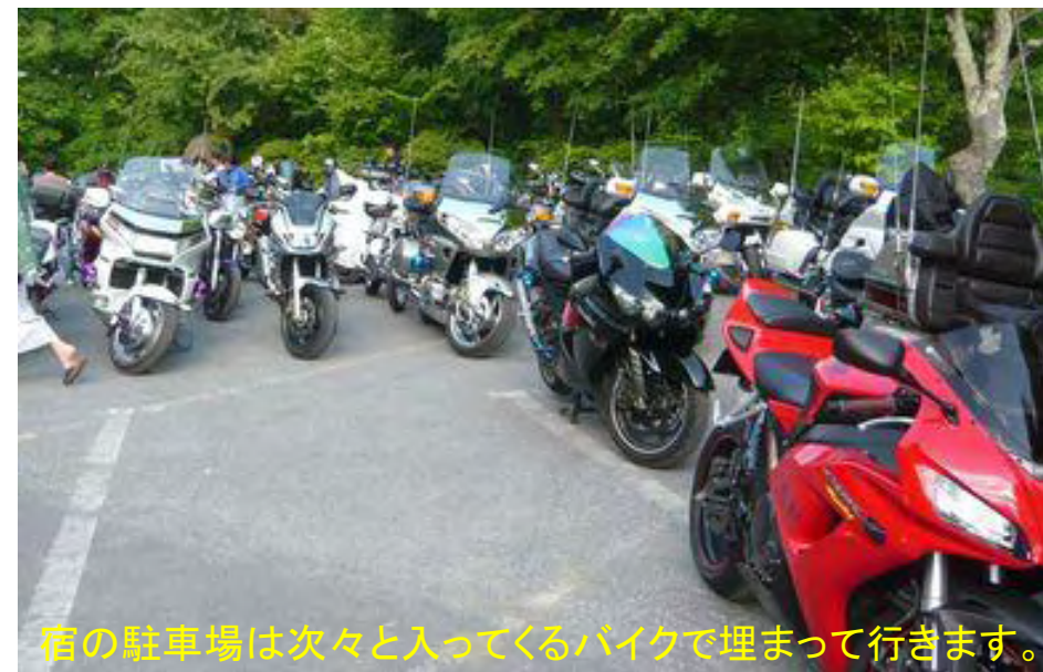
宿の駐車場は次々と入ってくるバイクで埋まって行きます。

“横谷温泉”へはスタッフは11時半集合で駐車場や宴会場、受付などを準備します。一緒に走ってきたメンバーには準備を手伝ってもらいます。14時頃になるとライダー達がぞくぞくとやって来て各スタッフは大忙しです。