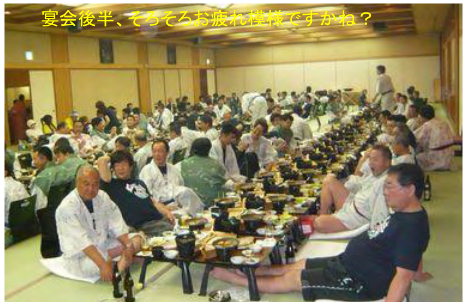
宴会後半、そろそろお疲れ模様ですかね？