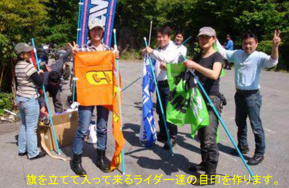
旗を立てて入ってくるライダー達の目印を作ります。