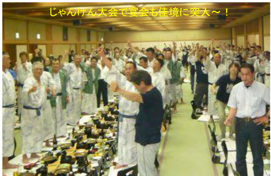
じゃんけん大会で宴会も佳境に突入～！

子連れライダーに記念品、ビールの一気飲み、じゃんけん大会、その他盛りだくさんのイベントが進み20時宴会終了、2次会に行く者、部屋に戻る物それぞれの夜が更けていきます。