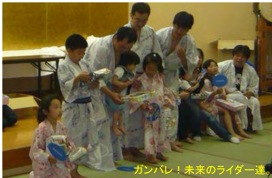
ガンバレ！未来のライダー達。