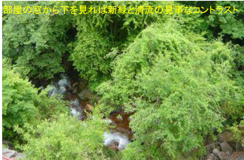
部屋の窓から下を見れば新緑と清流の見事なコントラスト

子連れライダーに記念品、ビールの一気飲み、じゃんけん大会、その他盛りだくさんのイベントが進み20時宴会終了、2次会に行く者、部屋に戻る物それぞれの夜が更けていきます。