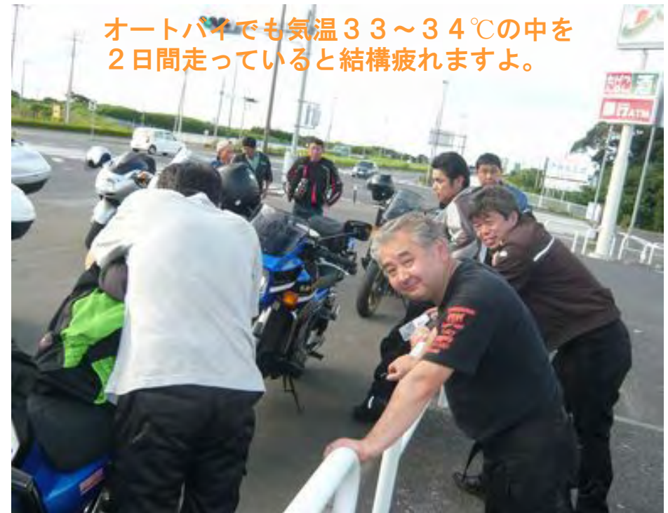
オートバイでも気温33~34℃の中を 2日間走っていると結構疲れますよ。

今回は2日間とも猛暑の中のツーリングとなりました、千葉県も暑いですが新潟県も暑かった！真夏のツーリングはマメに休憩と水分補給を怠らずに！が基本ですね、月岡温泉ツーリングもとても辛くて楽しい経験でした、夕方5時半、全員の無事を確認して解散となりました。次は10月の紅葉ツーリングだ！さて、何処へ行こうかな？ではまた！