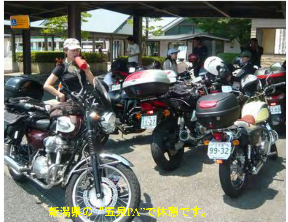
新潟県の“五泉PA”で休憩です。