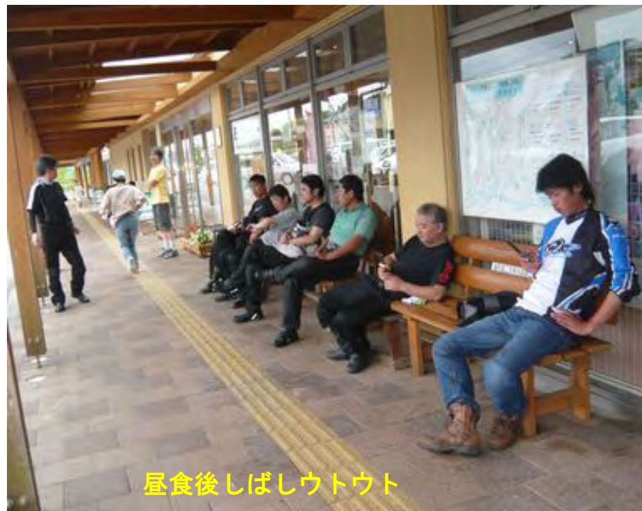
昼食後しばしウトウト