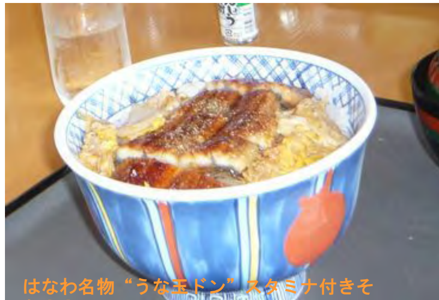
はなわ名物“うな玉どん”スタミナ付きそう!!