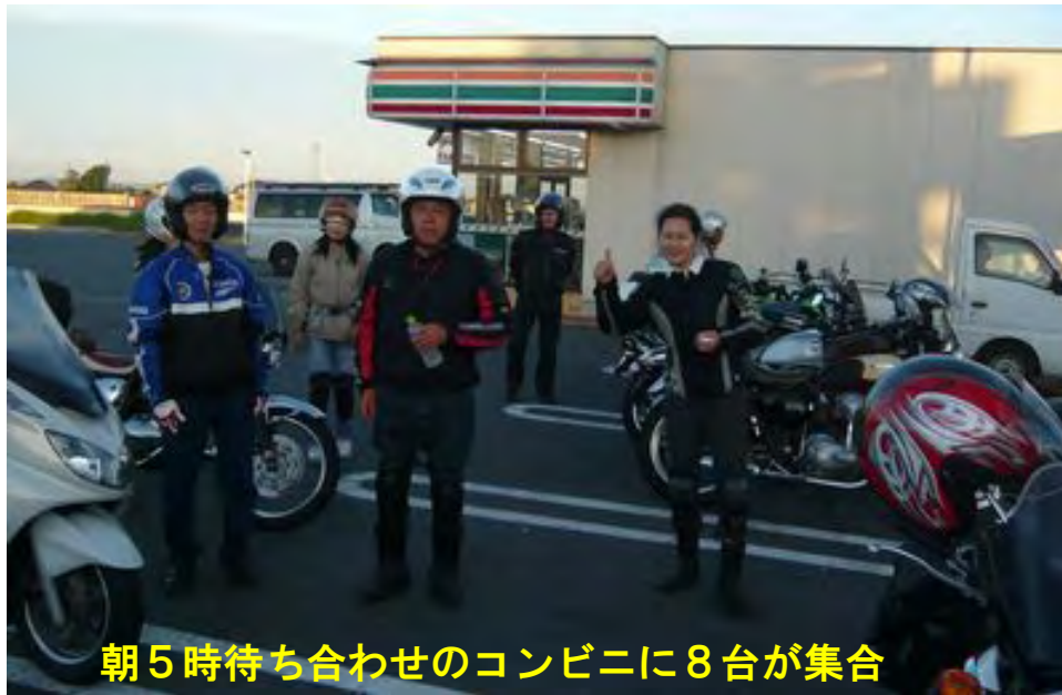
朝5時待ち合わせのコンビニに8台が集合