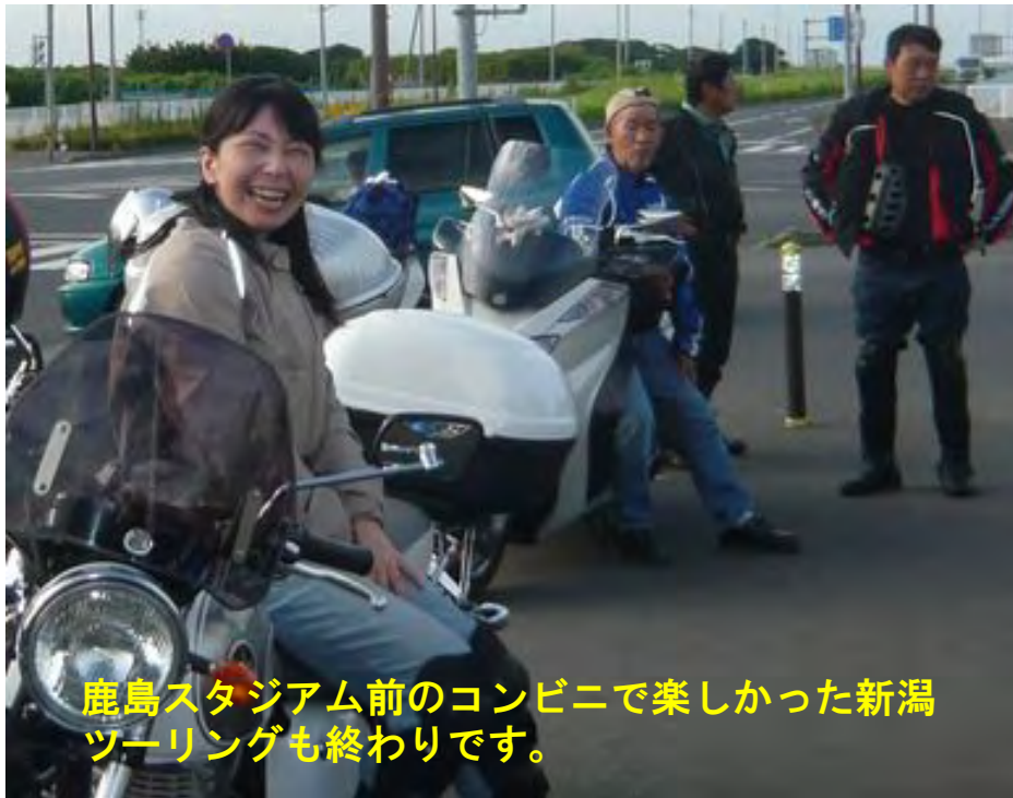
鹿島スタジアム前のコンビニで楽しかった新潟 ツーリングも終わりです。