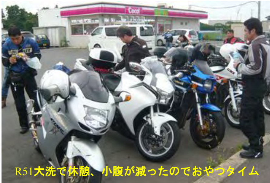
R51大洗で休憩、小腹が減ったのでおやつタイム