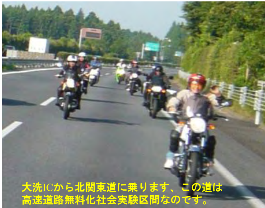
大洗ICから北関東道に乗ります、この道は 高速道路無料化社会実験区間なのです。