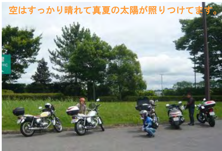
空はすっかり晴れて真夏の太陽が照りつけてます。