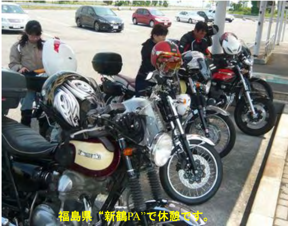
福島県“新鶴PA”で休憩です。