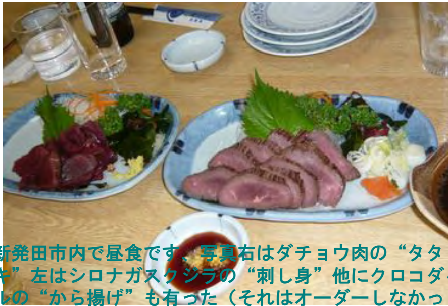
新発田市内で昼食です、写真右はダチョウ肉の“タタキ”左はシロナガスクジラの“刺し身”他にクロコダイルの“から揚げ”も有った（それはオーダーしなかった）