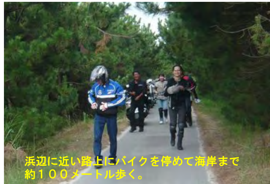
浜辺に近い路上にバイクを停めて海岸まで約100メートル歩く。

この方向に“佐渡島”が見えるはずなのだが、今日は見えなかった、太平洋を見慣れている私たちには日本海の色が黒く感じたのだった。