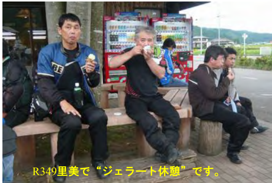
R349里美で“ジェラート休憩”です。