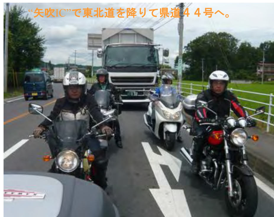
“矢吹IC”で東北道を降りて県道44号へ。