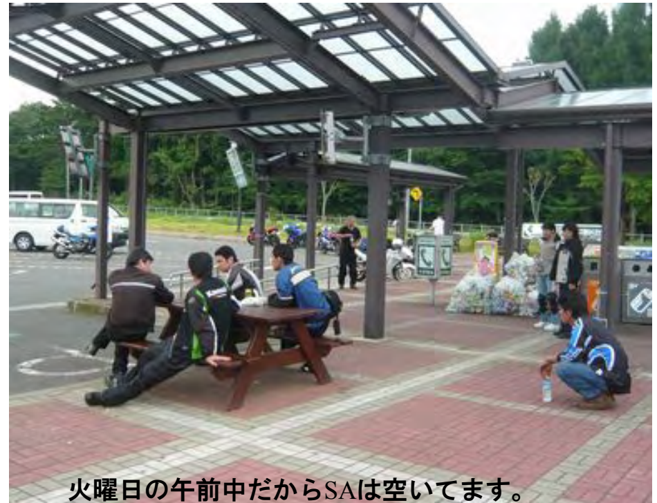
火曜日の午前中だからSAは空いてます。