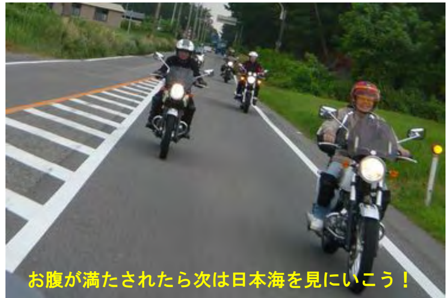
お腹が満たされたら次は日本海を見にいこう！