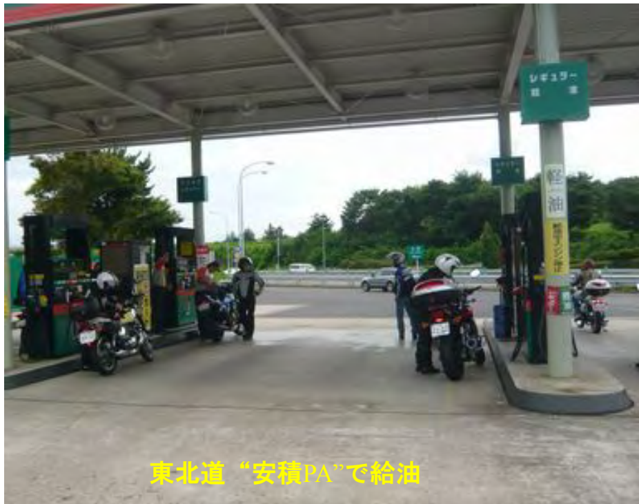
東北道“安積PA”で給油