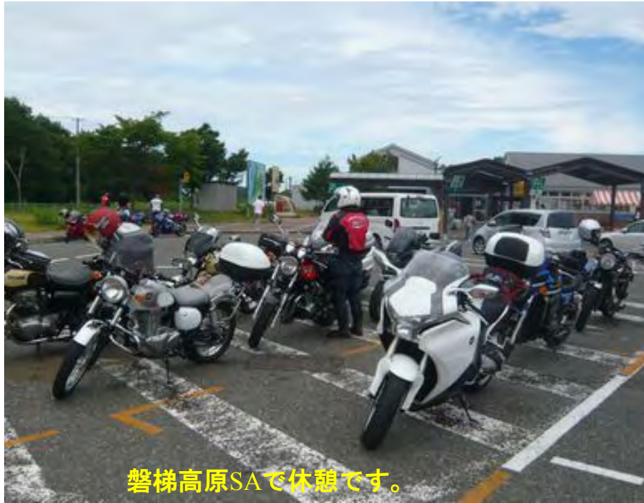
磐梯高原SAで休憩です。