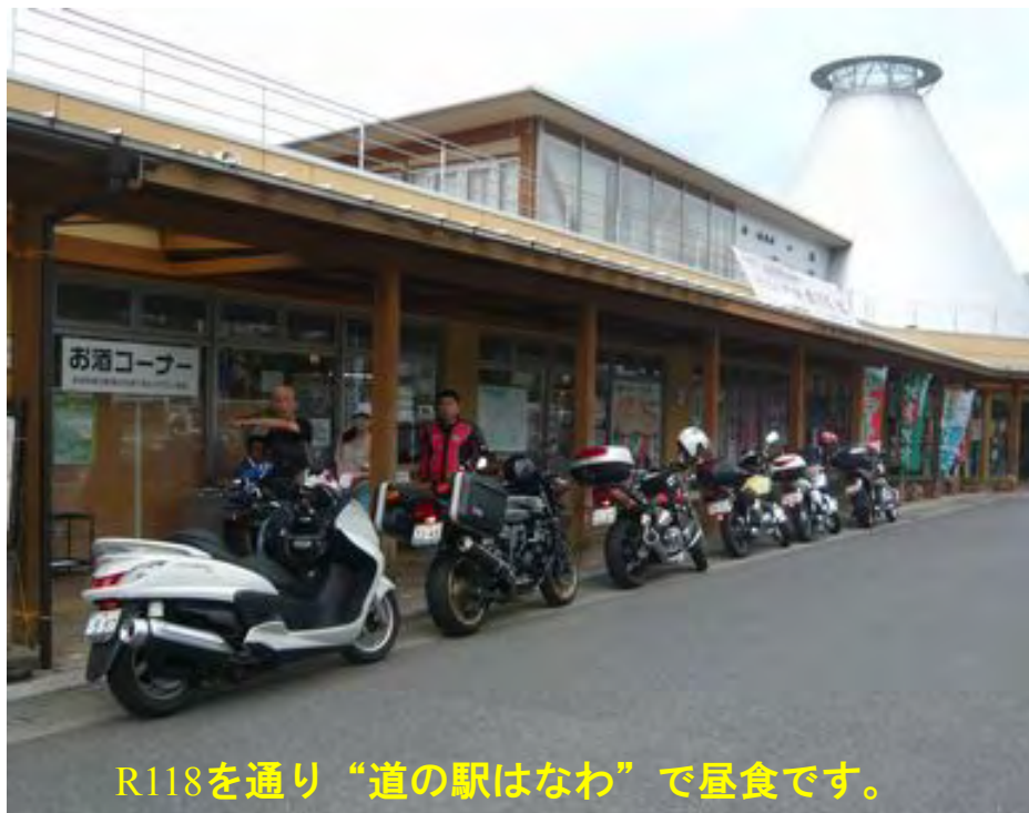
R118を通り“道の駅はなわ”で昼食です。