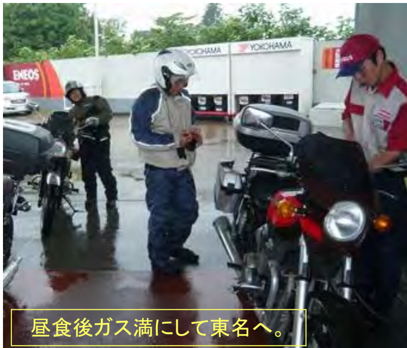
昼食後ガス満にして東名へ。