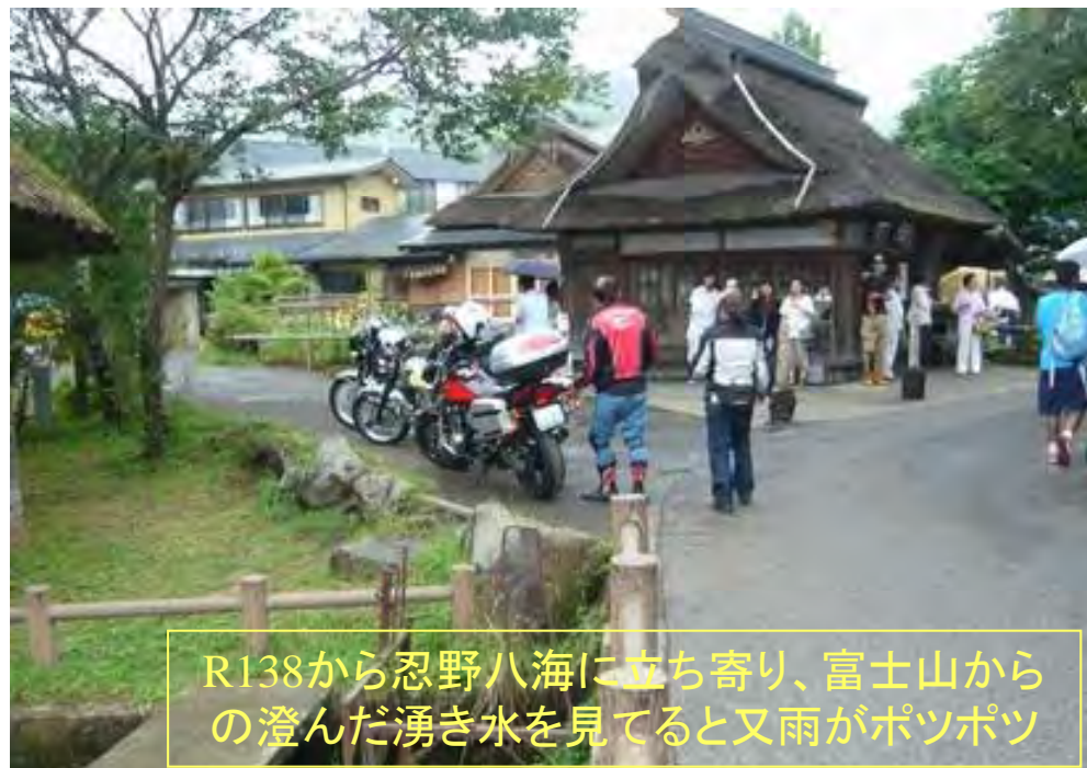
R138から忍野八海に立ち寄り、富士山からの澄んだ湧き水を見てると又雨がポツポツ