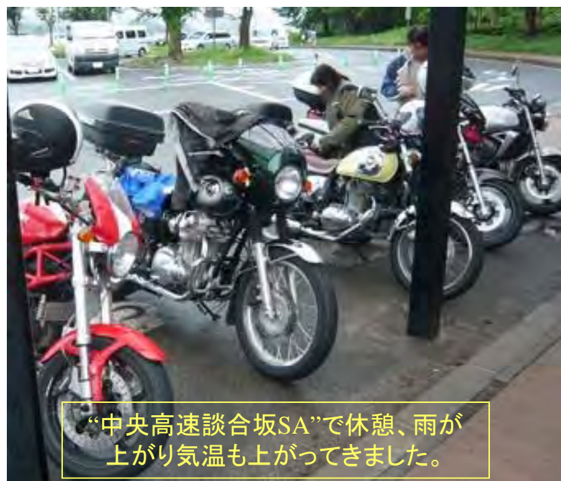
“中央高速談合坂SA”で休憩、雨が上がり気温も上がってきました。