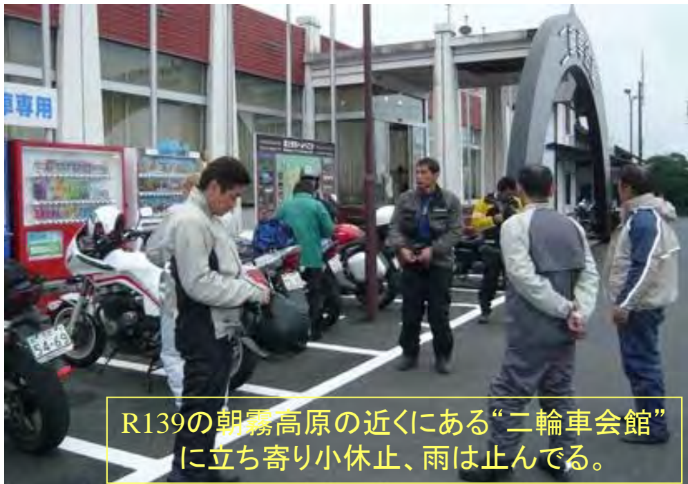
R139の朝霧高原の近くにある“二輪車会館” に立ち寄り小休止、雨は止んでる。