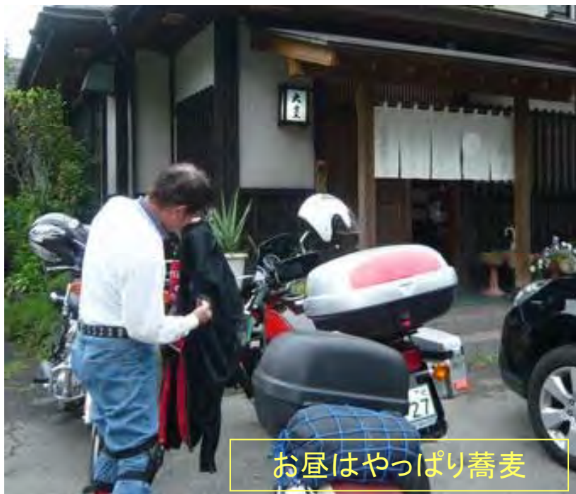
お昼はやっぱり蕎麦