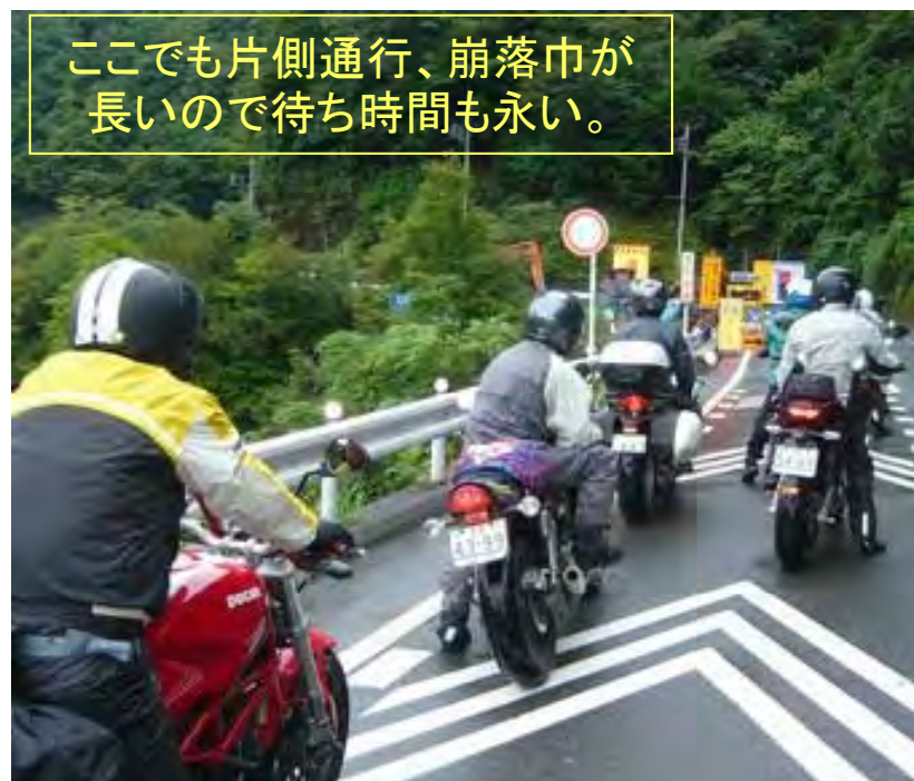
ここでも片側通行、崩落巾が長いので待ち時間も長い。