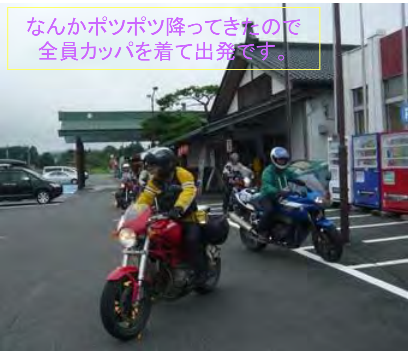
なんかポツポツ降ってきたので 全員カッパを着て出発です。