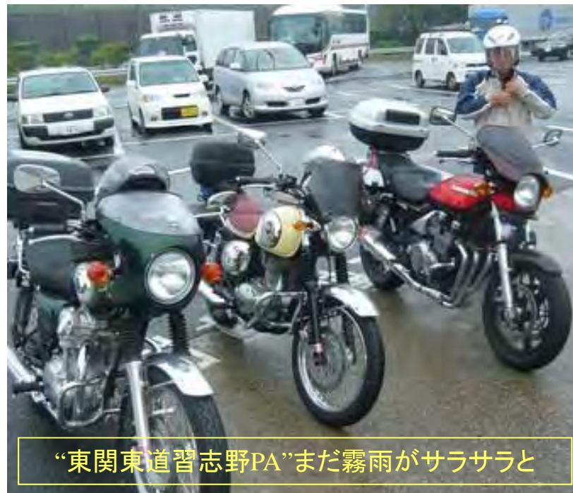
“東関東道習志野PA”まだ霧雨がサラサラと