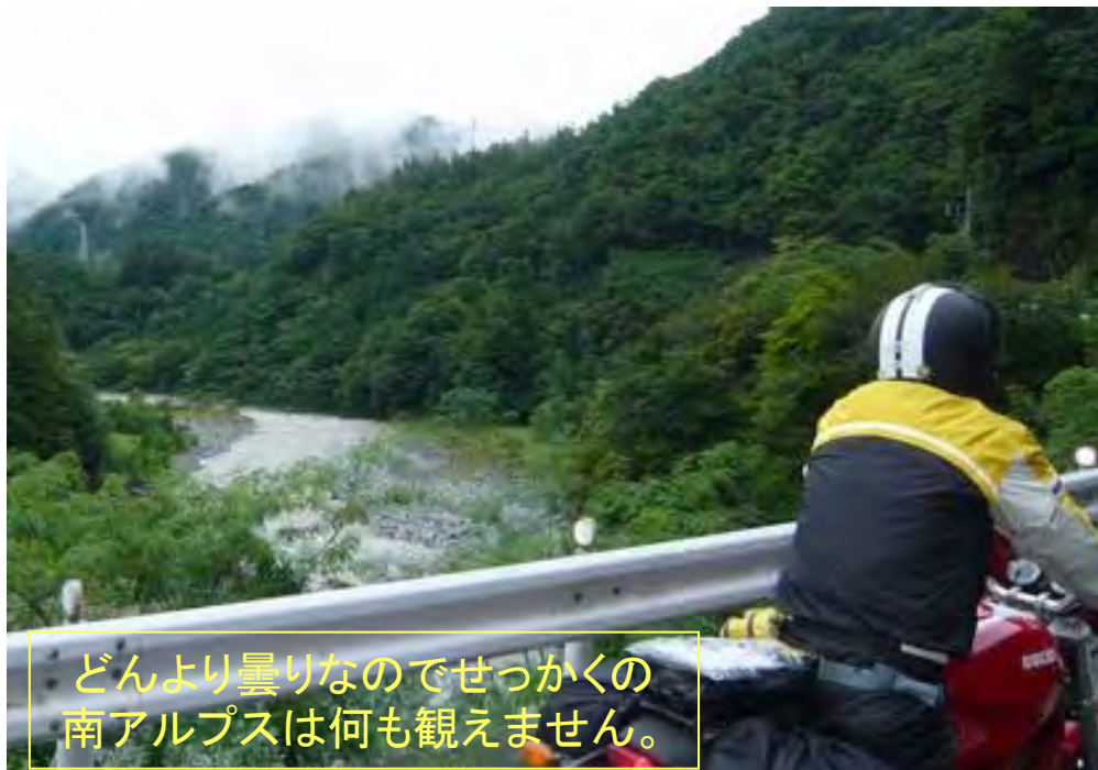
どんより曇りなのでせつかくの南アルプスは何も観えません。