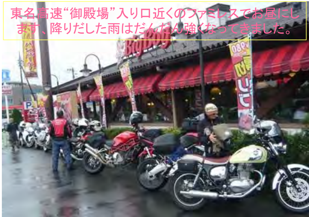
東名高速“御殿場”入り口近くのファミレスでお昼に します、降りだした雨はだんだん強くなってきました。