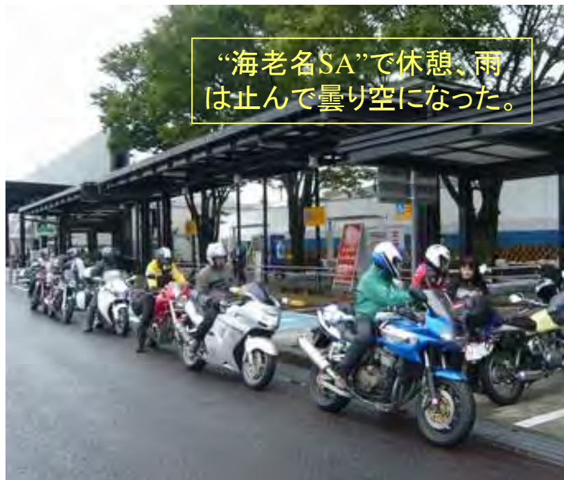
“海老名SA”で休憩、雨は止んで曇り空になった。