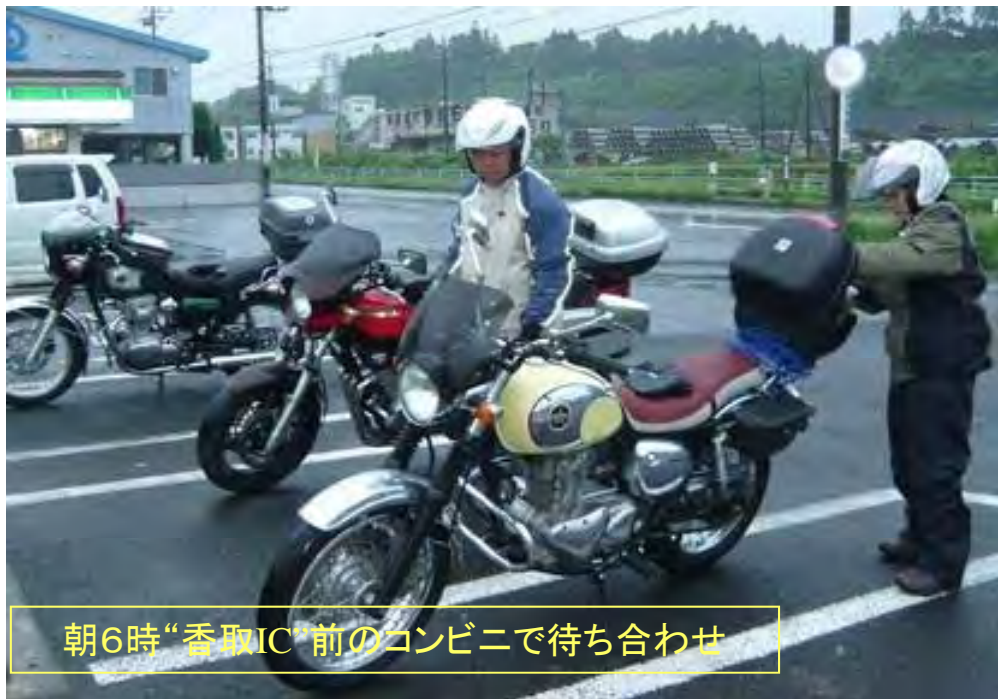
朝6時“香取IC”前のコンビニで待ち合わせ