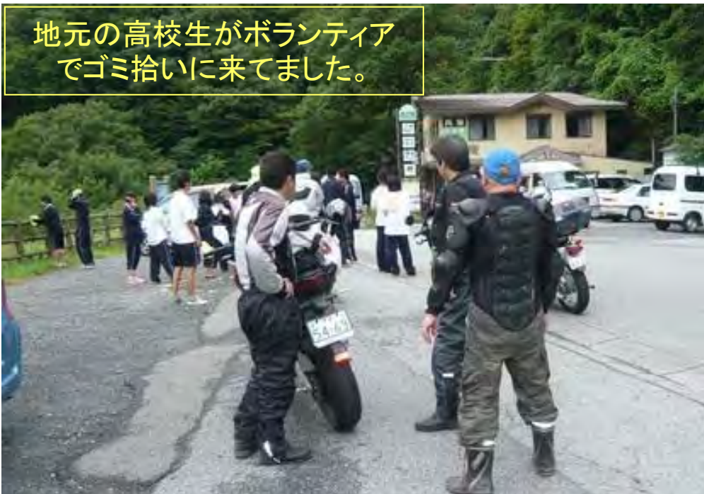
地元の高校生がボランティア でゴミ拾いに来ました。