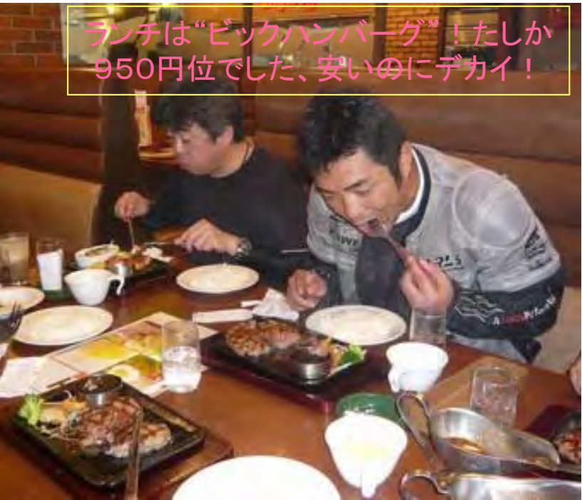
ランチは“ビックハンバーグ”！たしか 950円位でした、安いのにデカイ！