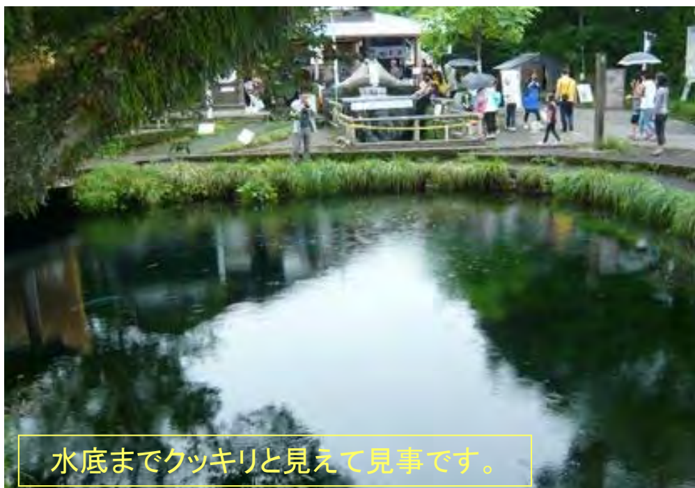
水底までクッキリと見えて見事です。