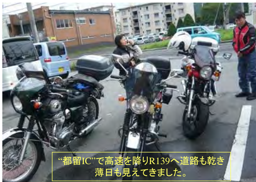
“都留IC”で高速を降りR139へ道路も乾き薄日も見えてきました。