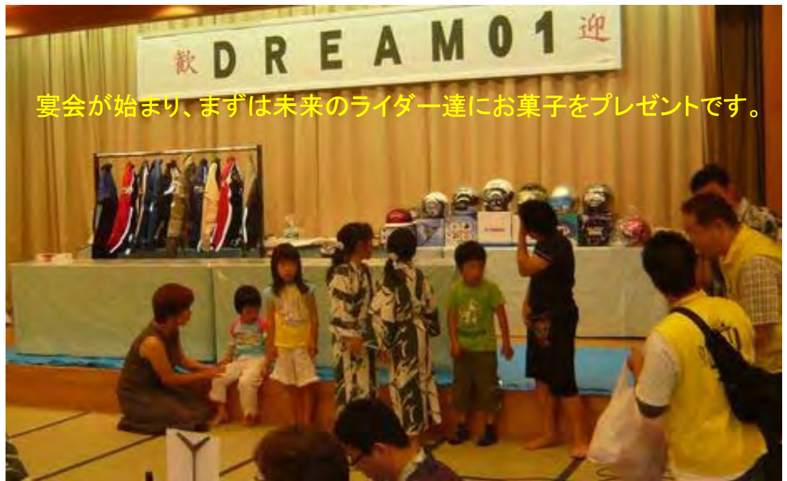
宴会が始まり、まずは未来のライダー達にお菓子をプレゼントです。