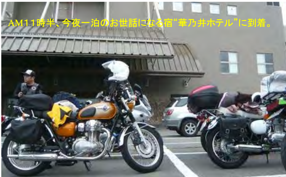
AM11時半、今夜一泊のお世話になる宿“華乃井ホテル”に到着。