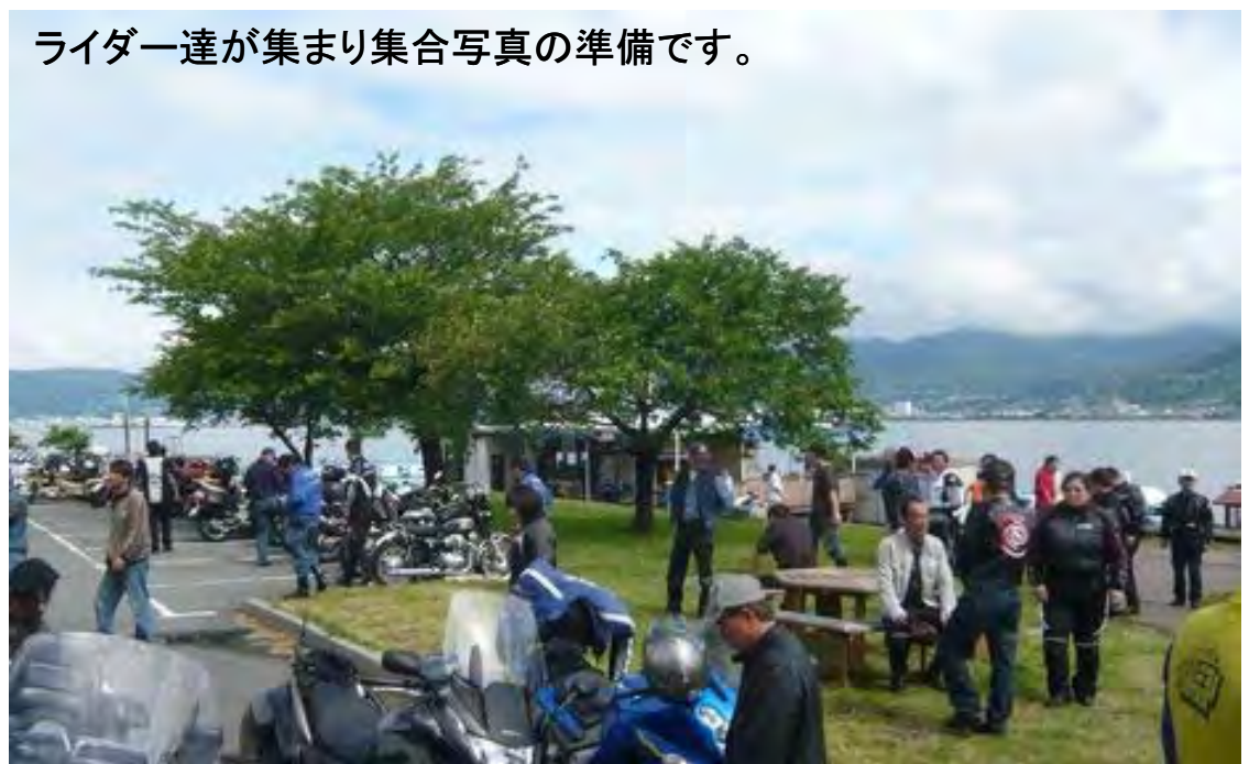
ライダー達が集まり集合写真の準備です。