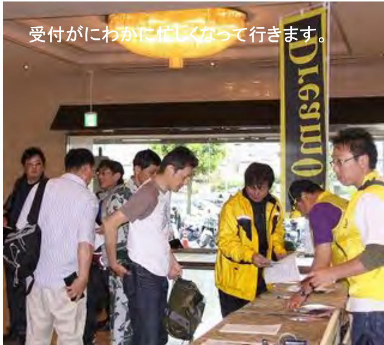
受付がにわかに忙しくなって行きます。