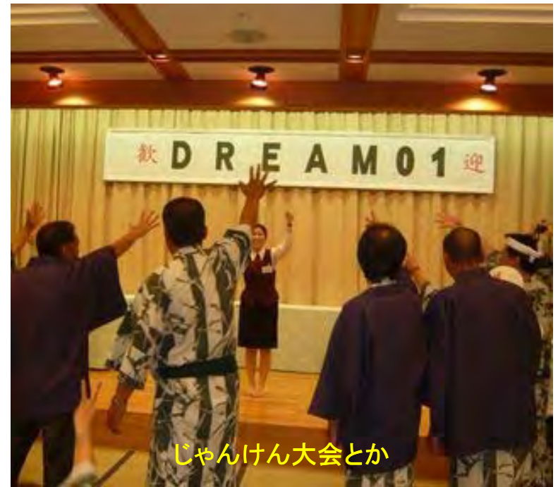
じゃんけん大会とか