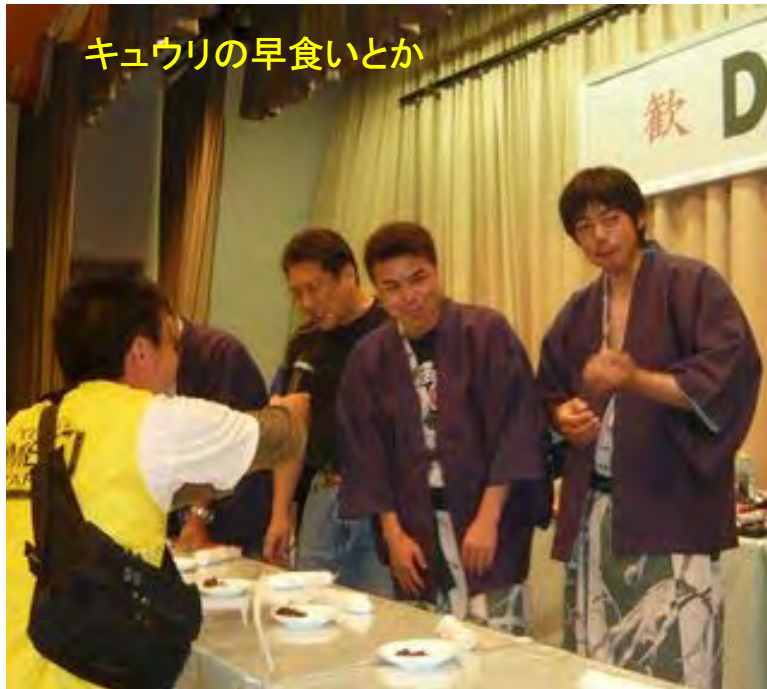
キュウリの早食いとか