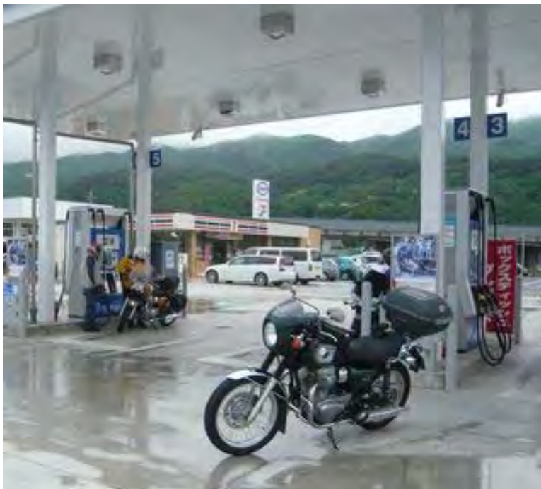
R20で雨は上がりましたが、全員カッパを着たままです。