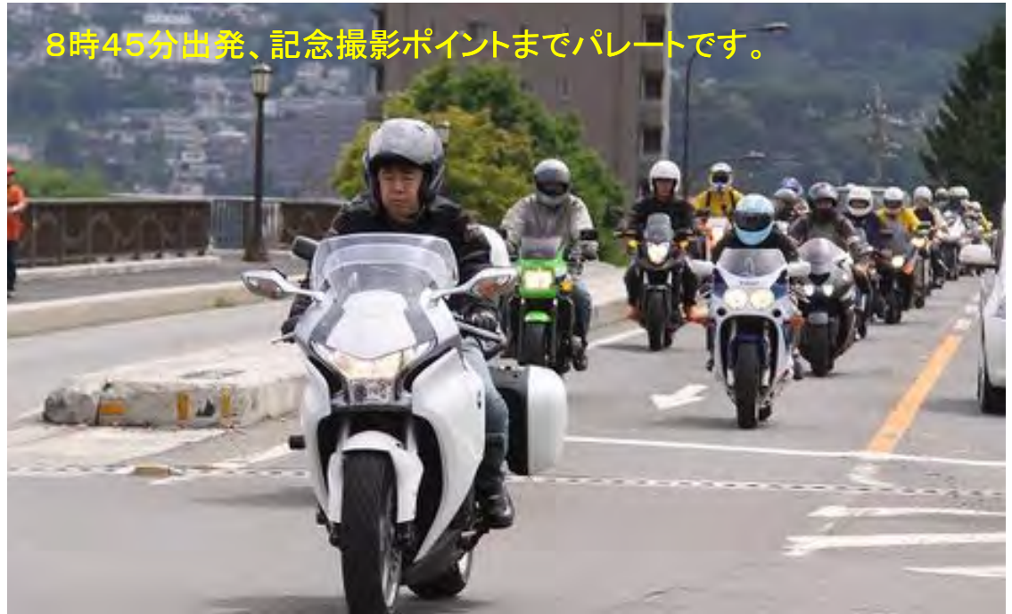
8時45分出発、記念撮影ポイントまでパレードです。