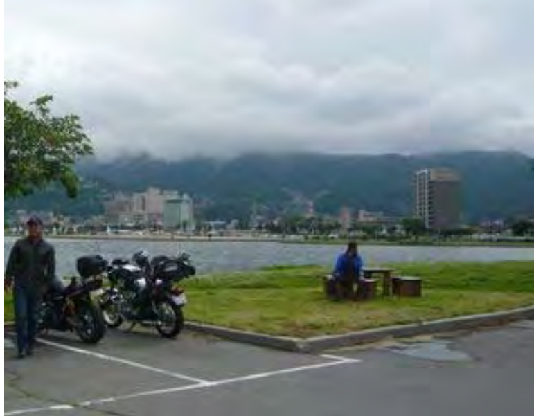
撮影ポイントは諏訪湖対岸の駐車場、スタッフ が先に行って場所取りをしてました。