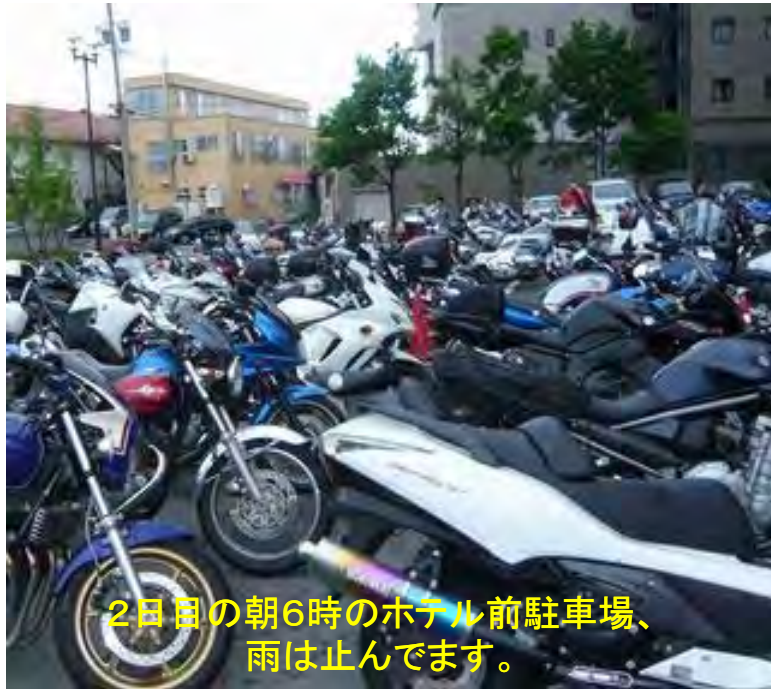
2日目の朝6時のホテル前駐車場、 雨は止んでいます。