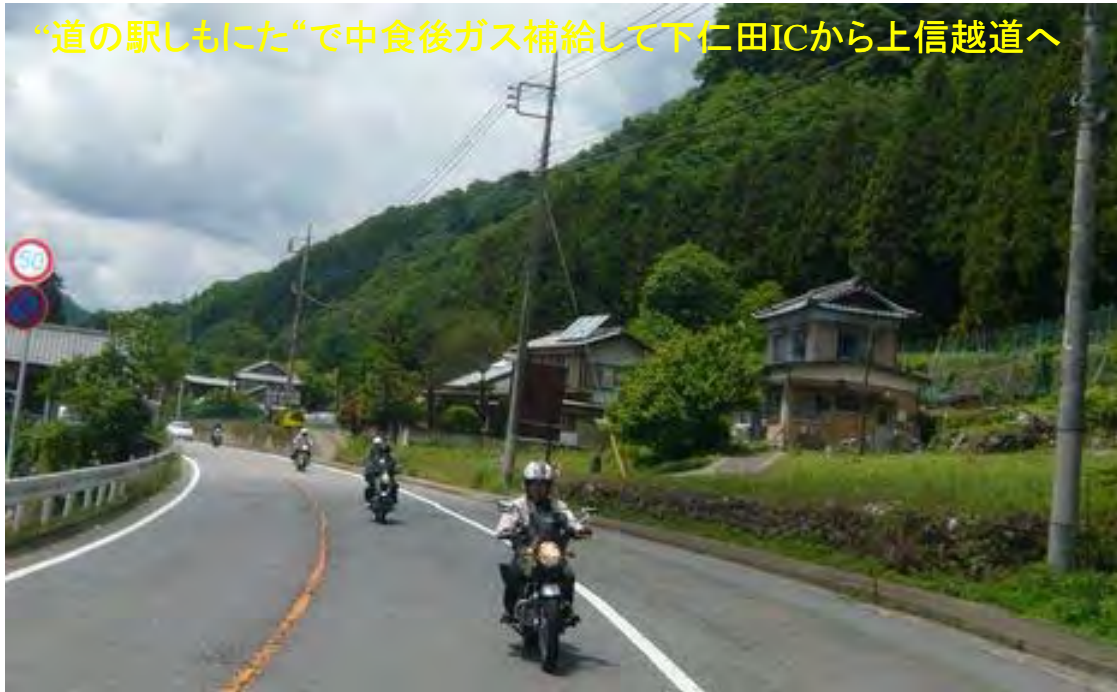
“道の駅しもにた”で中食後ガス補給して下仁田ICから上信越道へ