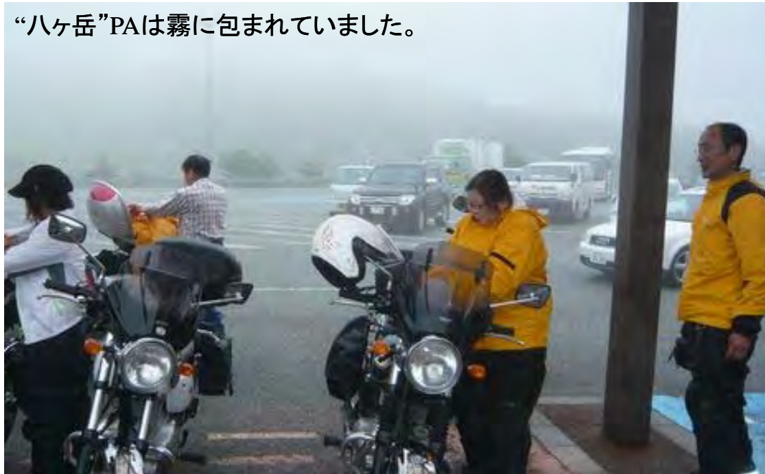
“八ヶ岳”PAは霧に包まれていました。