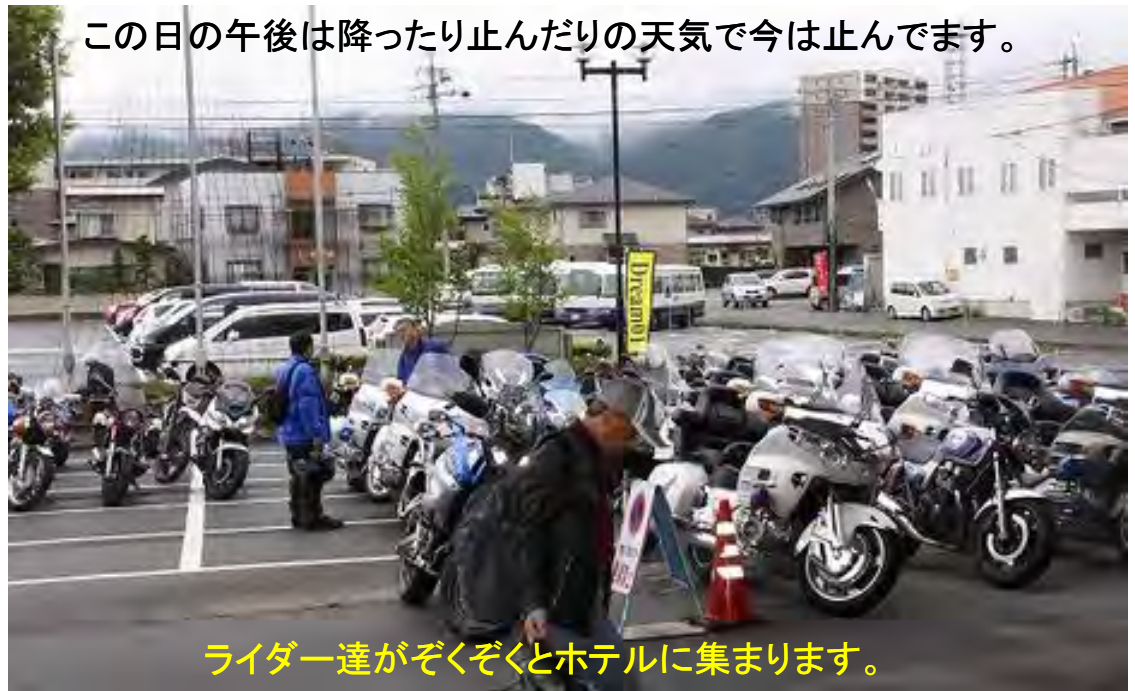
この日の午後は降ったり止んだりの天気では今は止んでます。