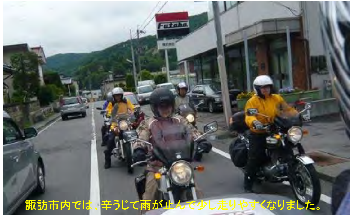
諏訪市内では、辛うじて雨が止んで少し走りやすくなりました。