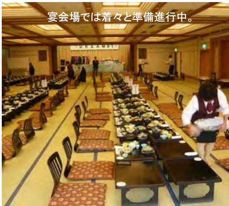
宴会場では着々と準備進行中。