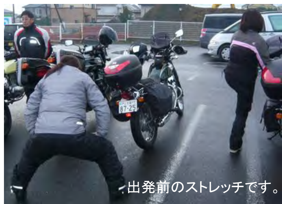
出発前のストレッチです。