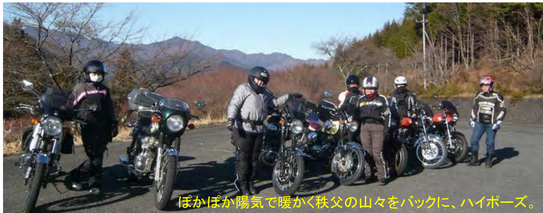
ぽかぽか陽気で暖かく秩父の山々をバックに、ハイポーズ。