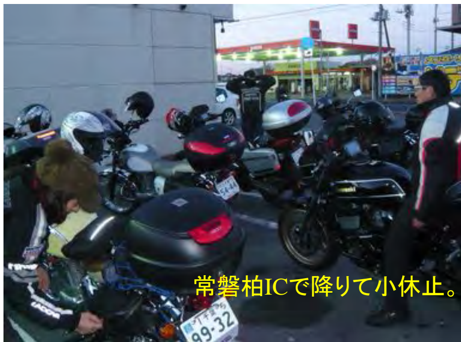
常磐柏ICで降りて小休止。