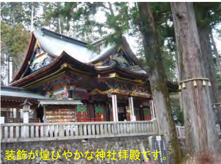
装飾が煌びやかな神社拝殿です。