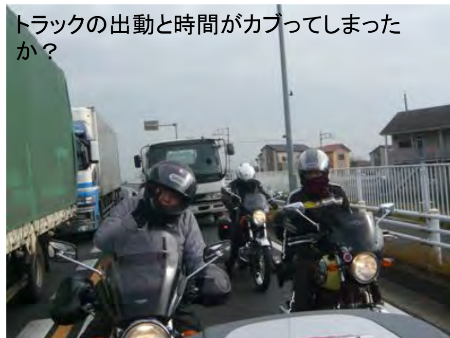
トラックの出動と時間がカブってしまったか？