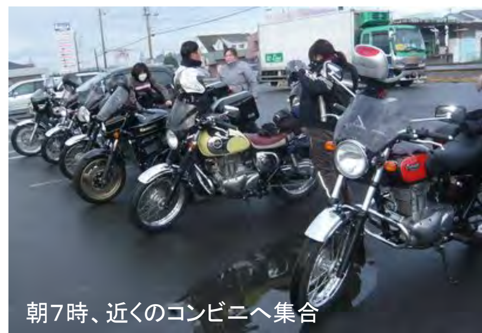
朝7時、近くのコンビニへ集合