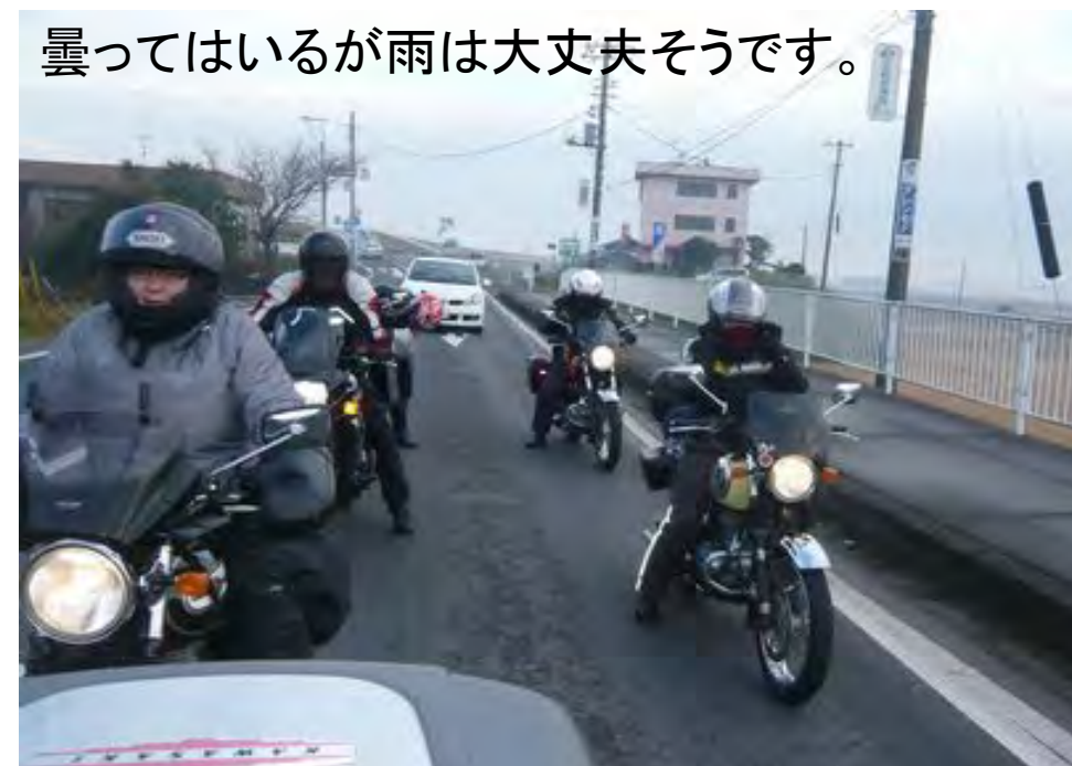
曇ってはいるが雨は大丈夫そうです。