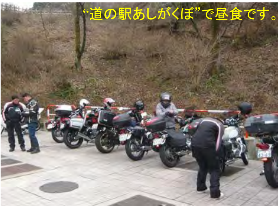
“道の駅あしがくぼ”で昼食です。