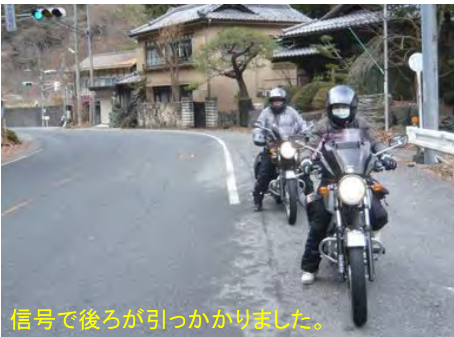
信号で後ろが引っかかりました。