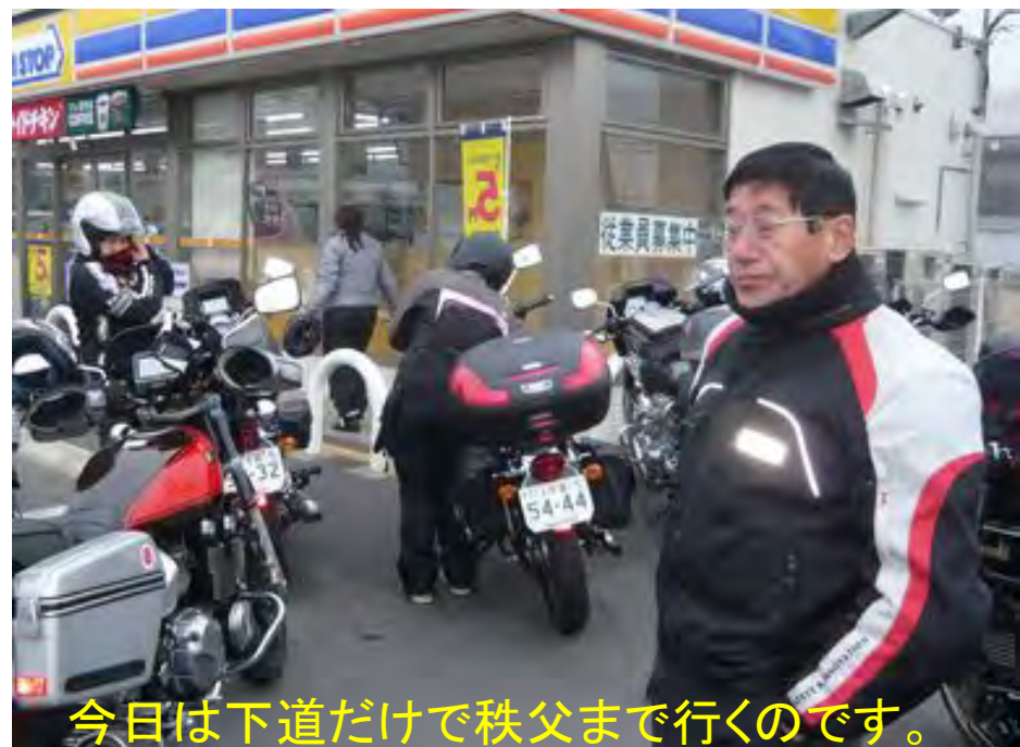
今日は下道だけで秩父まで行くのです。