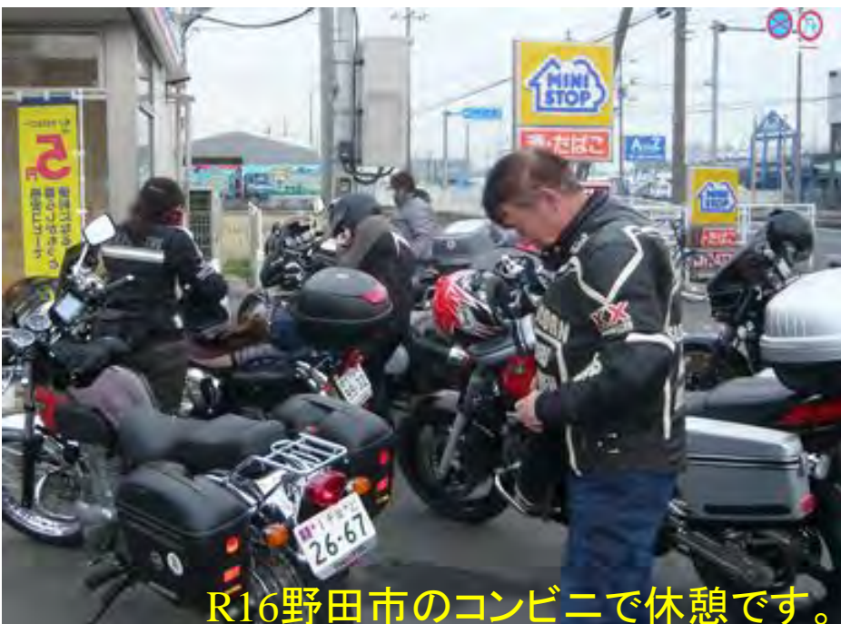
R16野田市のコンビニで休憩です。