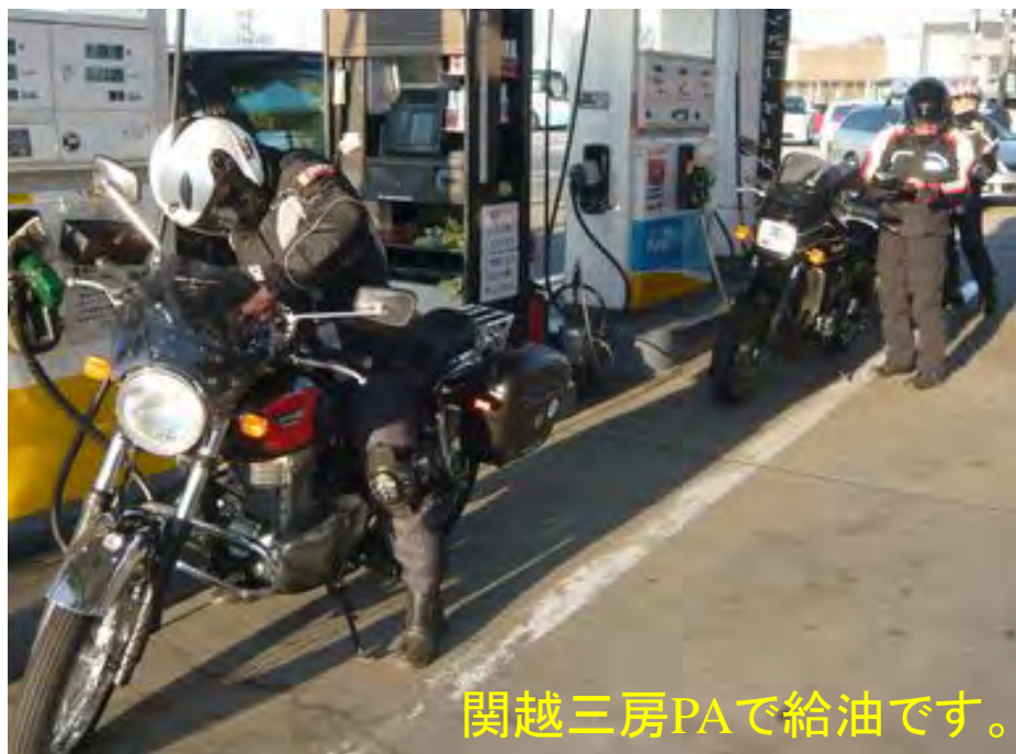
関越三房PAで給油です。