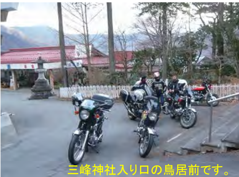
三峰神社入り口の鳥居前です。