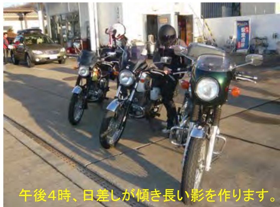
午後4時、日差しが傾き長い影を作ります。