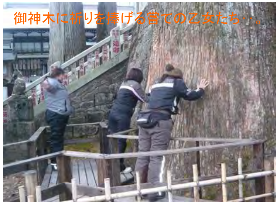
御神木に祈りを捧げる嘗ての乙女たち…。