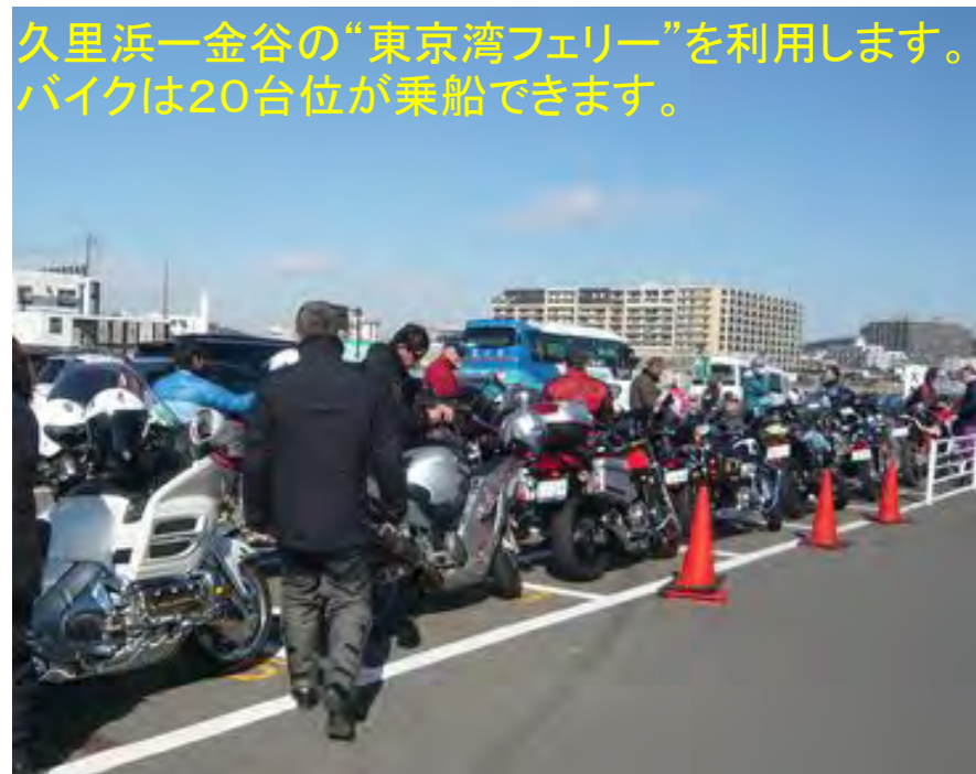
久里浜一金谷の“東京湾フェリー”を利用します。 バイクは20台位が乗船できます。