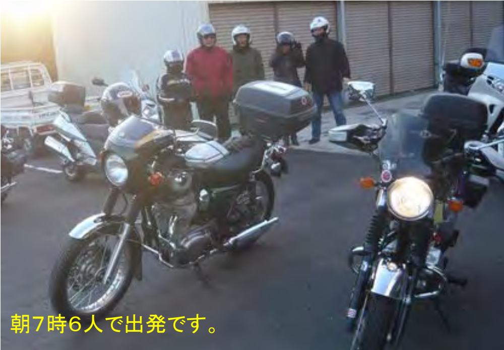
朝7時6人で出発です。