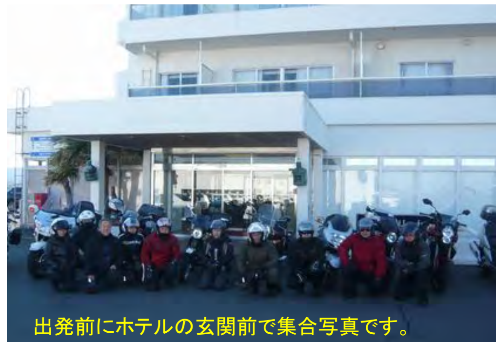
出発前にホテルの玄関前で集合写真です。