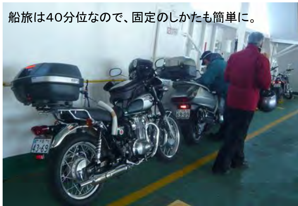
船旅は40分位なので、固定のしかたも簡単に。