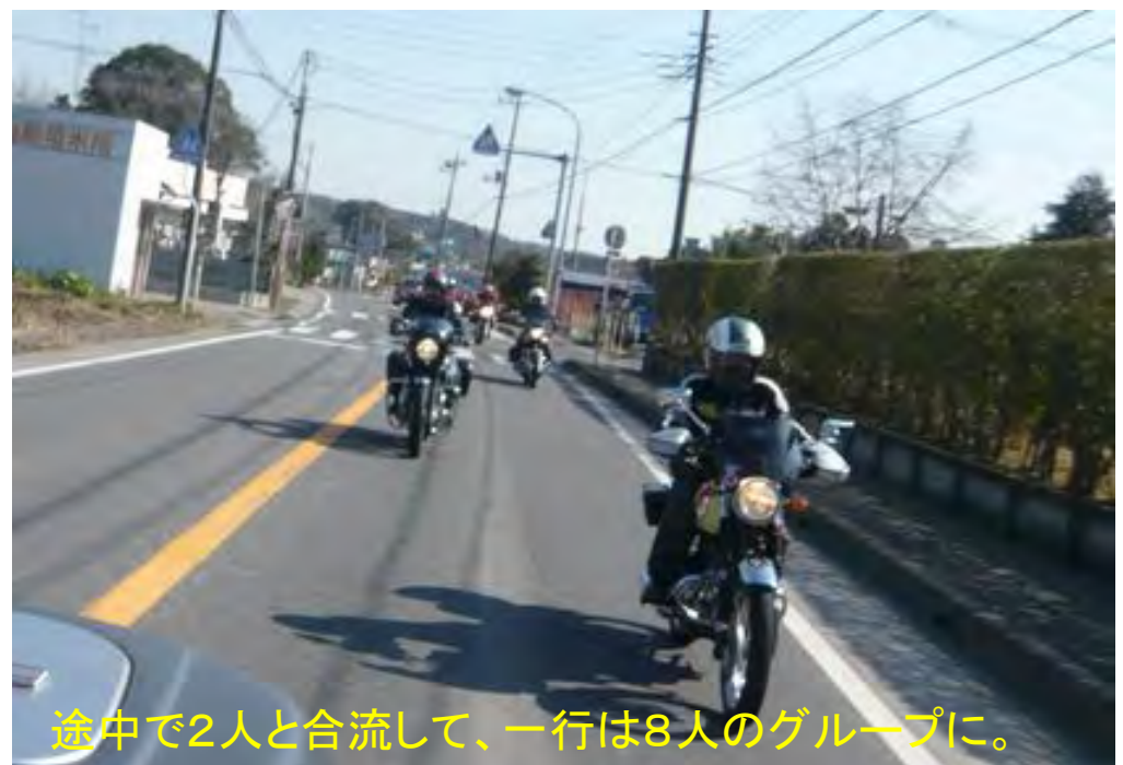
途中で2人と合流して、一行は8人のグループに。