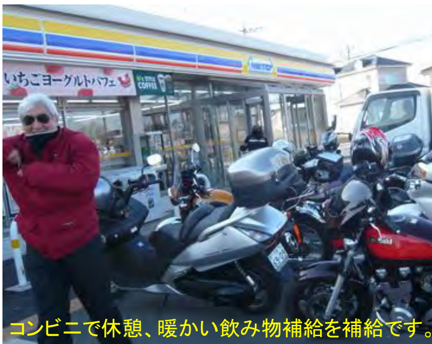
コンビニで休憩、暖かい飲み物補給を補給です。