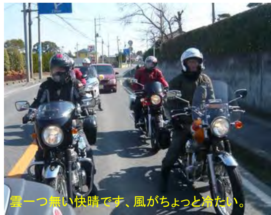
雲一つ無い快晴です、風がちょっと冷たい。