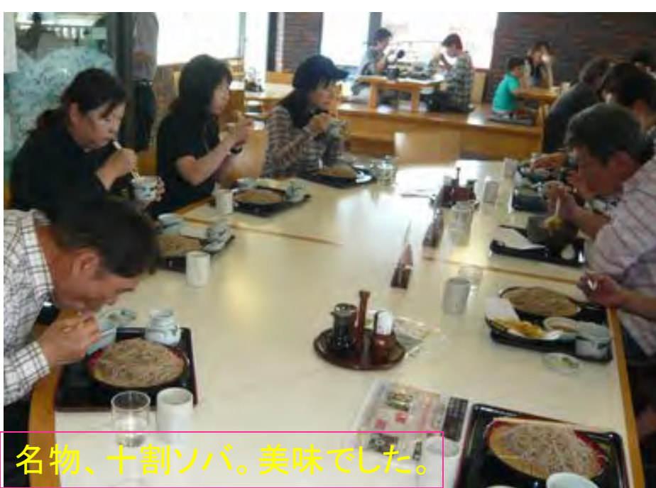
名物、十割ソバ。美味でした。