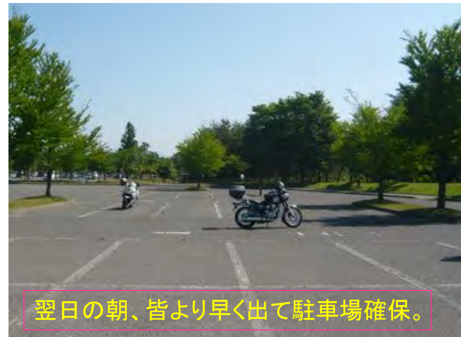
翌日の朝、皆より早く出て駐車場確保。