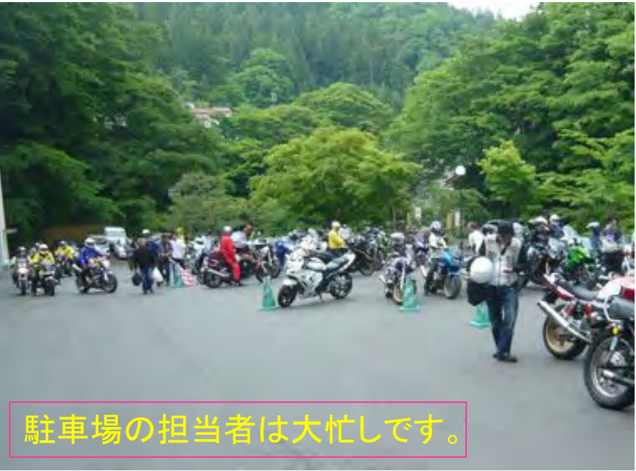
駐車場の担当者は大忙しです。