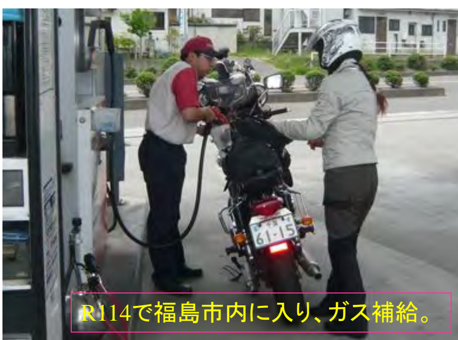
R114で福島市内に入り、ガス補給。