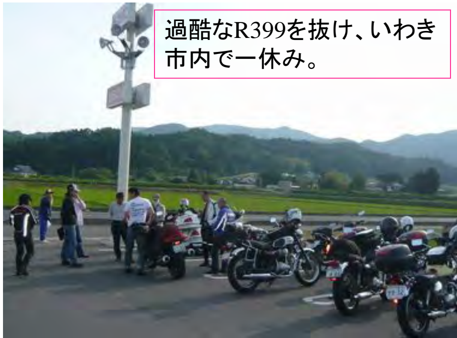
過酷なR399を抜け、いわき市内で一休み。