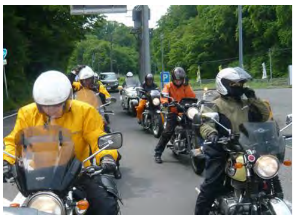
ここでカッパを脱ぎます。