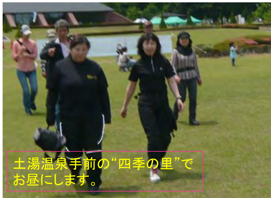
土湯温泉手前の“四季の里”でお昼にします。