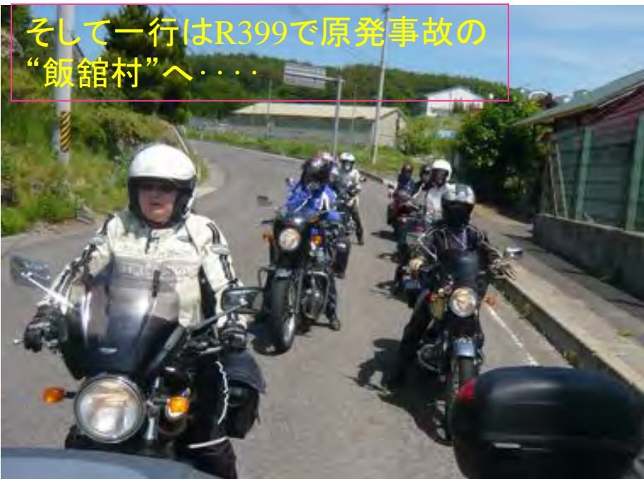
そして一行はR399で原発事故の“飯舘村”へ……