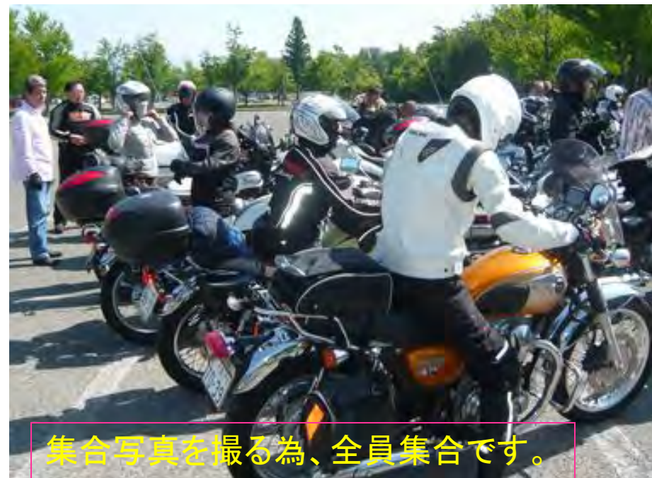
集合写真を撮る為、全員集合です。