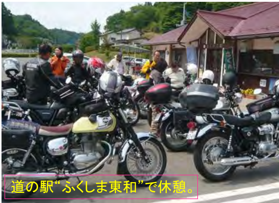
道の駅“ふくしま東和”で休憩。