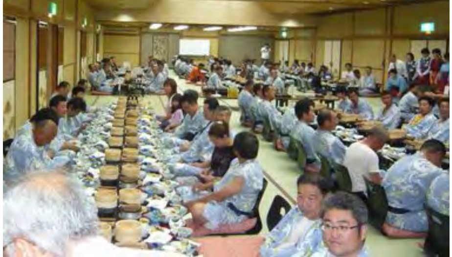
そしてPM6時、148人の大宴会の始まりです。