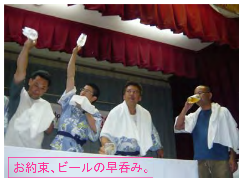
お約束、ビールの早呑み。