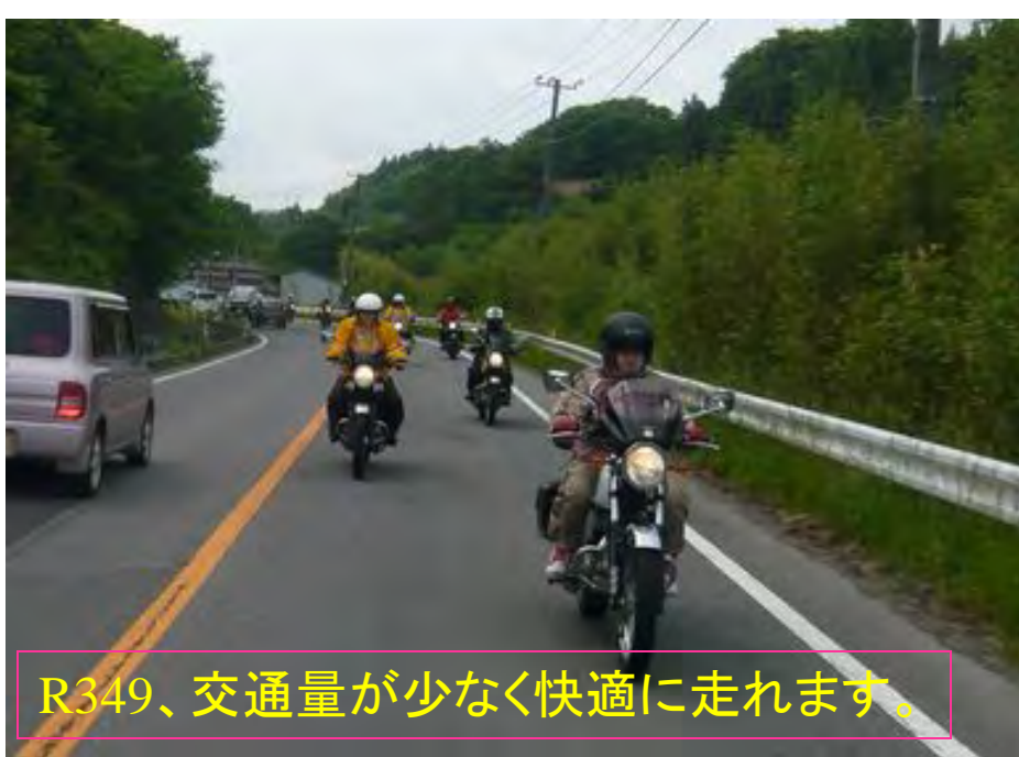
R349、交通量が少なく快適に走れます。