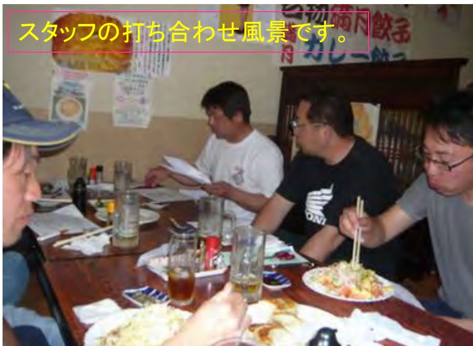
スタッフの打ち合わせ風景です。