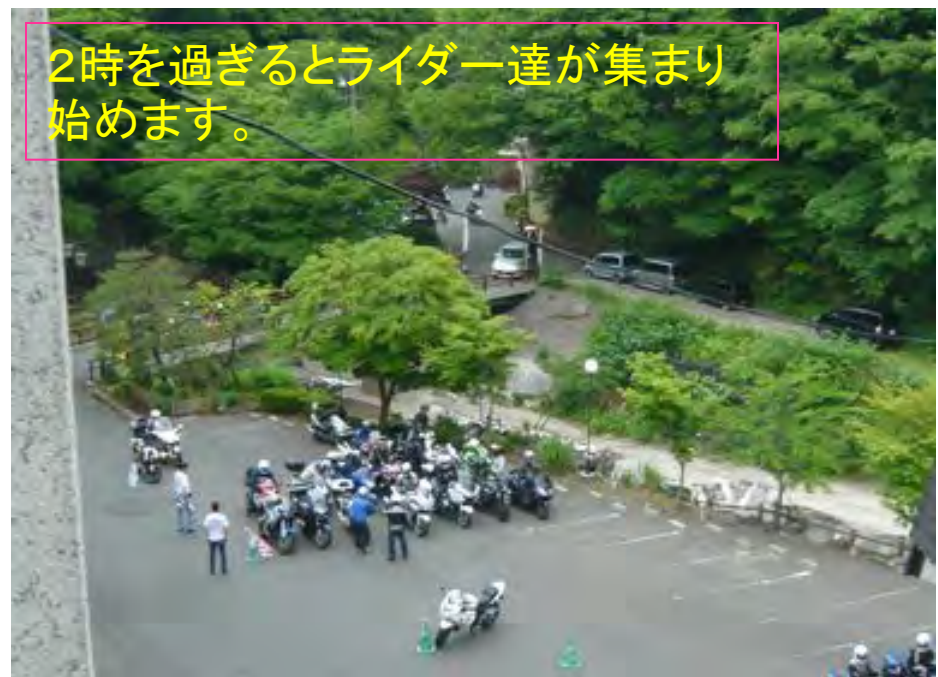
2時を過ぎるとライダー達が集まり始めます。