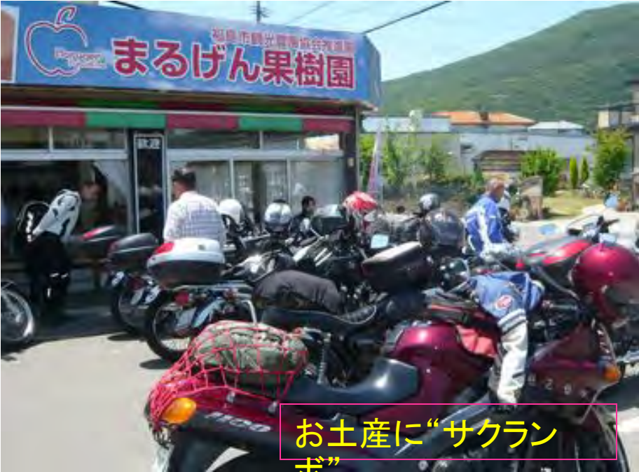
お土産に“サクランボ”