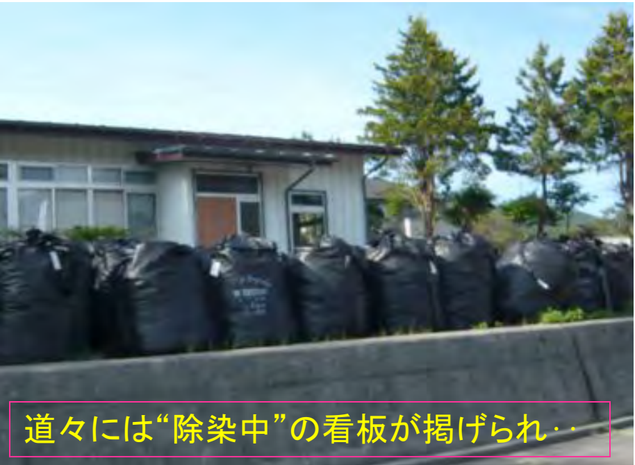
道々には“除染中”の看板が掲げられ…