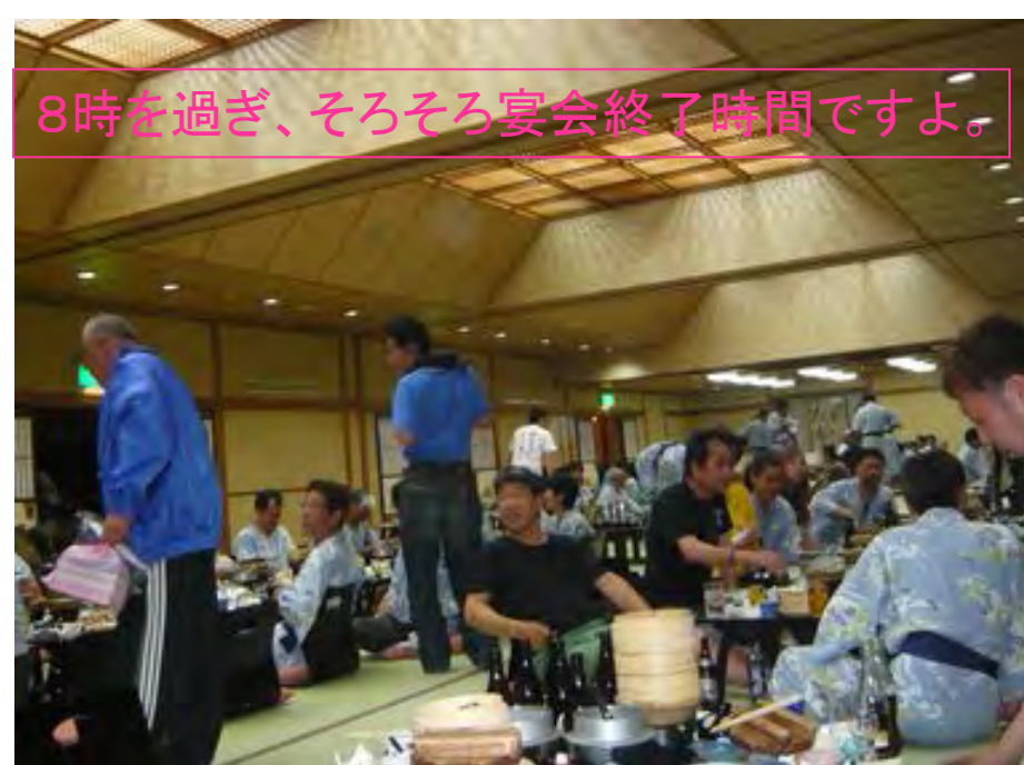
8時を過ぎ、そろそろ宴会終了時間ですよ。