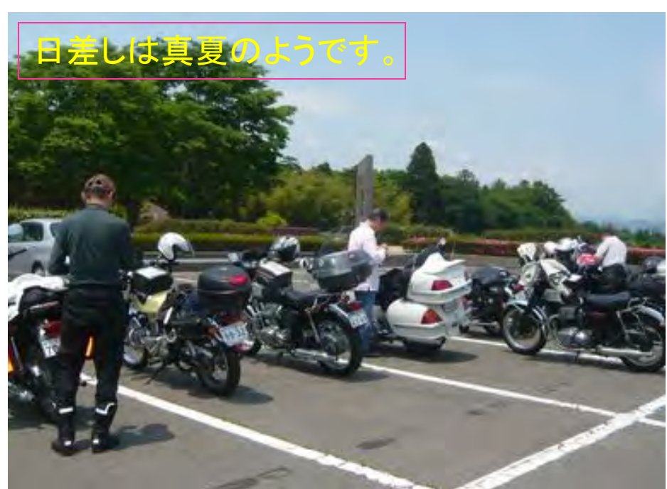
日差しは真夏のようにです。