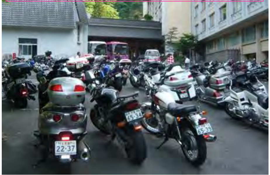
ホテルの駐車場がバイクで埋まりました。