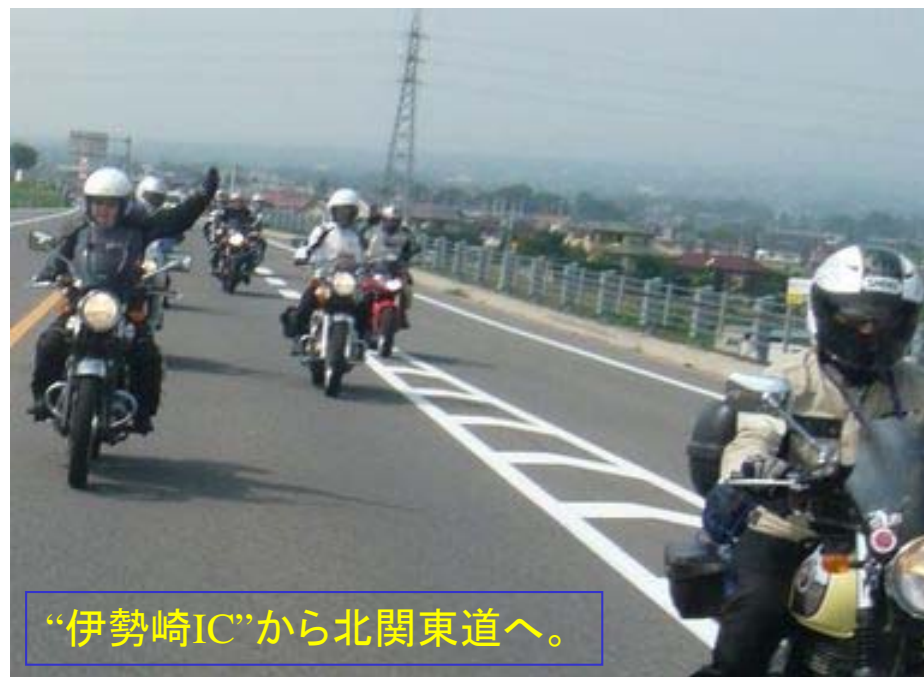
“伊勢崎IC”から北関東道へ。