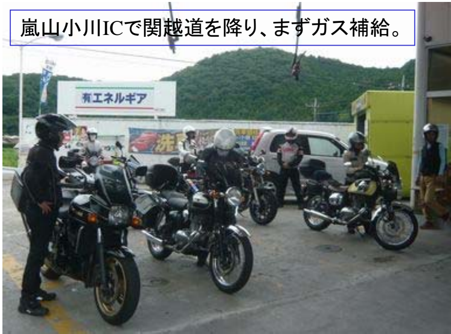
嵐山小川ICで関越道を降り、まずガス補給。