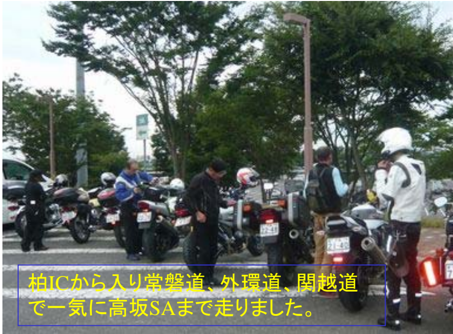
柏ICから入り常磐道、外環道、関越道 で一気に高坂SAまで走りました。