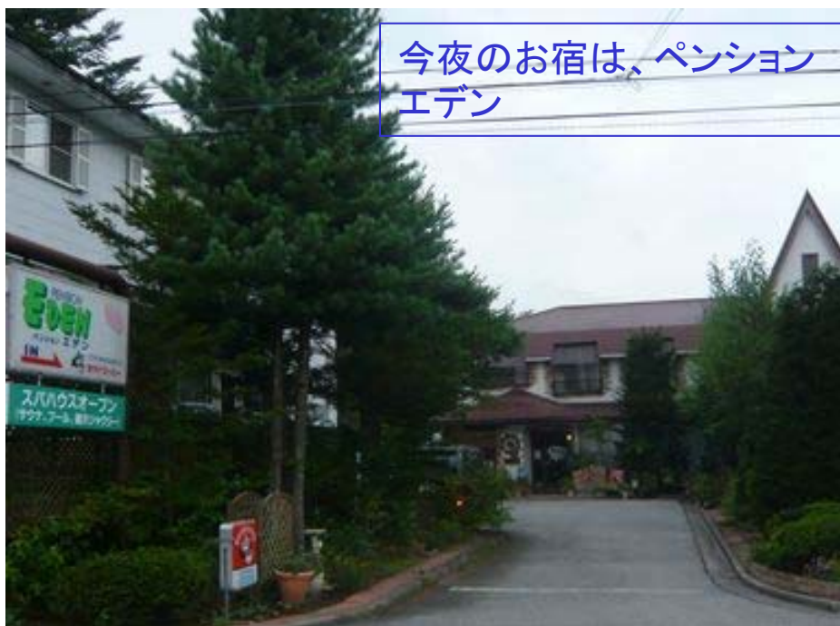
今夜のお宿は、ペンションエデン