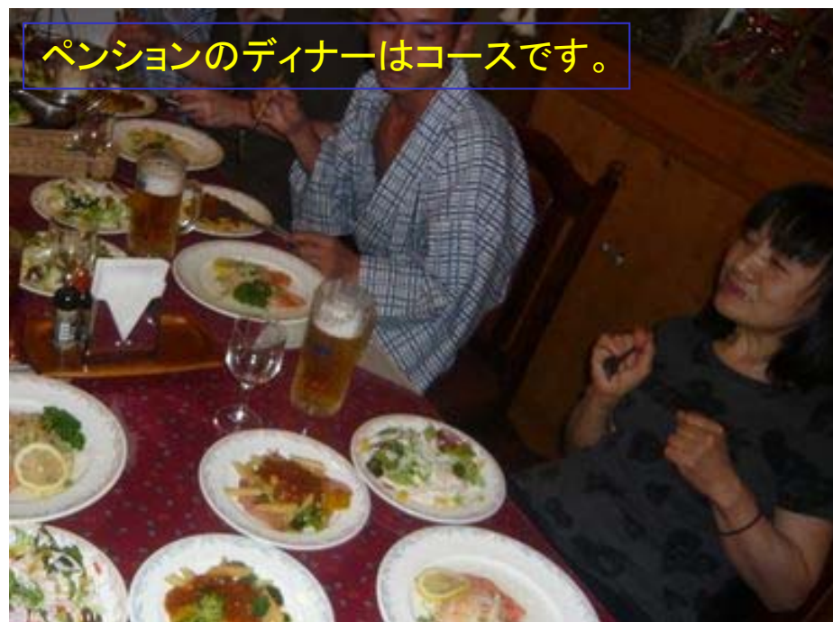
ペンションのディナーはコースです。