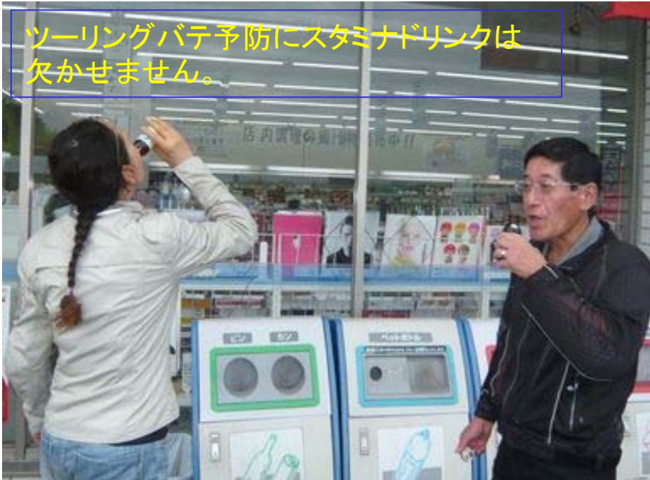
ツーリングバテ予防にスタミナドリンクは 欠かせません。