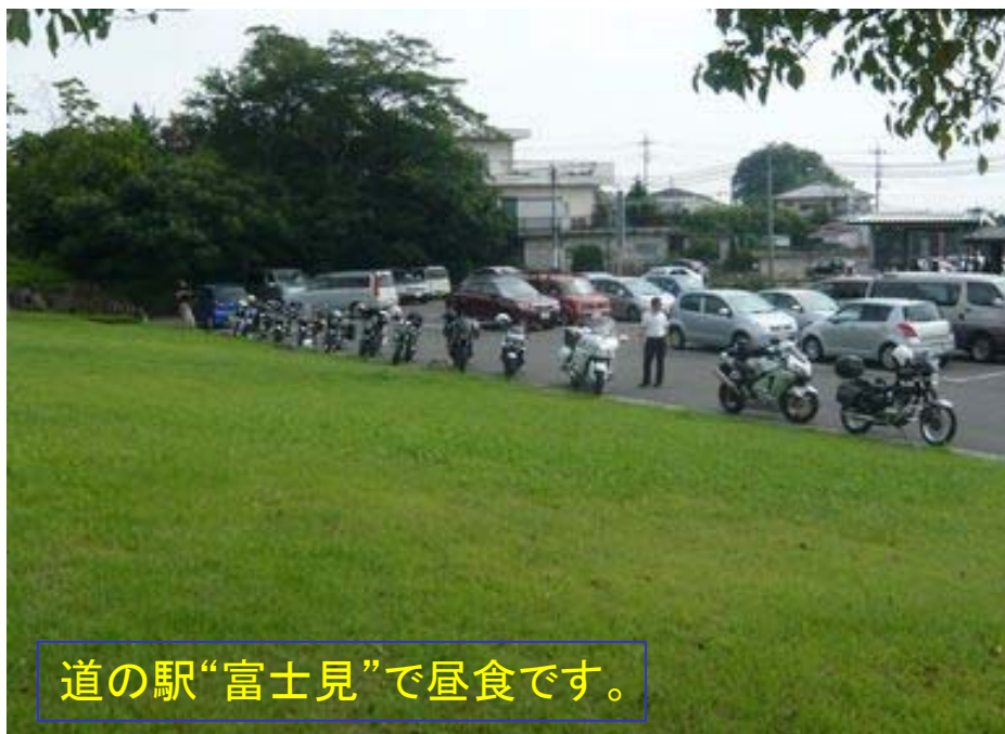
道の駅“富士見”で昼食です。