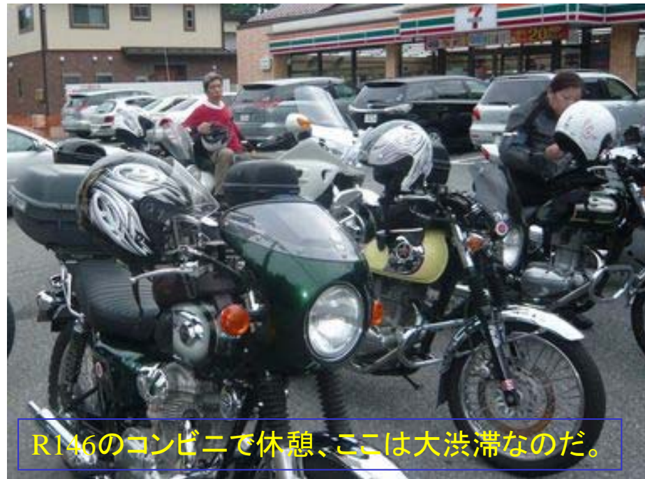
R146のコンビニで休憩、ここは大渋滞なのだ。