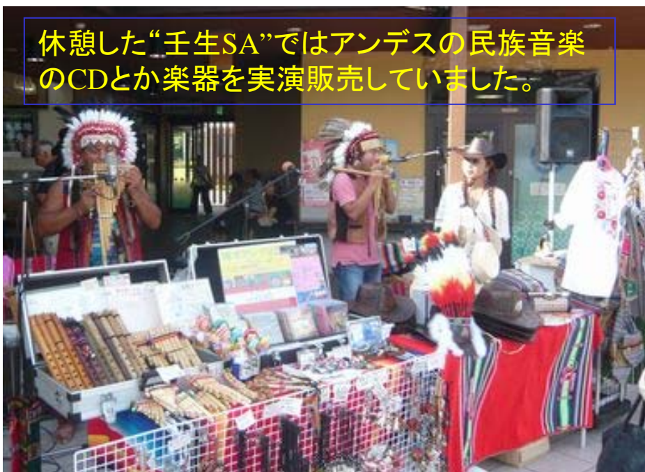
休憩した“壬生SA”ではアンデスの民族音楽のCDとか楽器を実演販売していました。