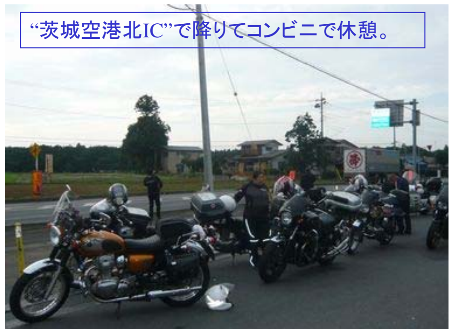
“茨城空港北IC”で降りてコンビニで休憩。