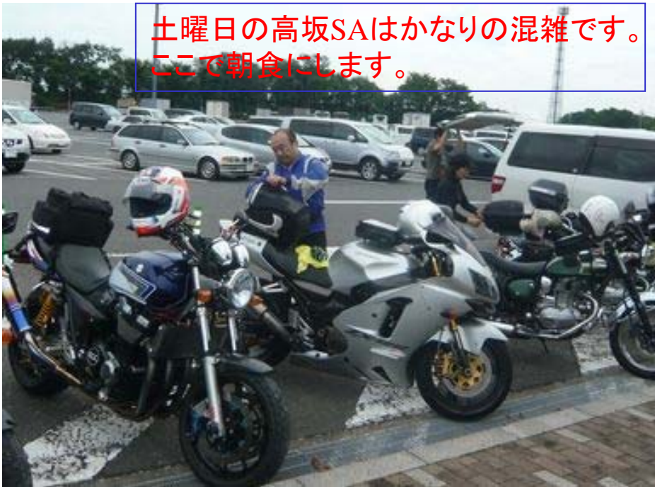
土曜日の高坂SAはかなりの混雑です。 ここで朝食にします。