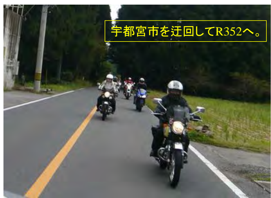
宇都宮市を迂回してR352へ。