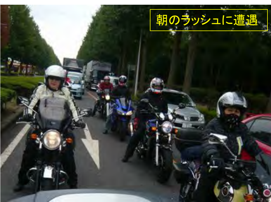
朝のラッシュに遭遇