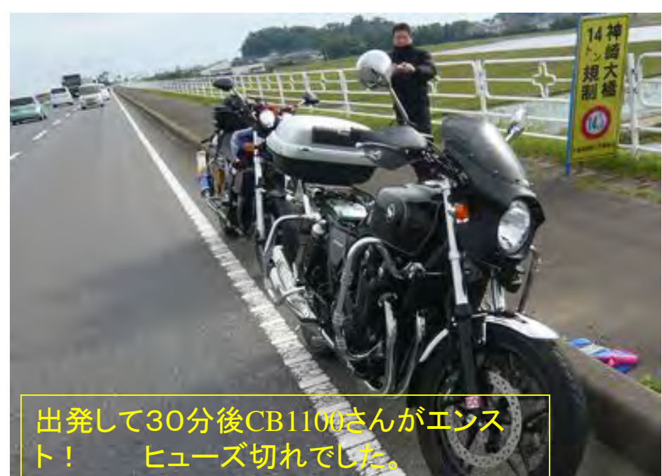
出発して30分後CB1100さんがエンスト！ ヒューズ切れでした。