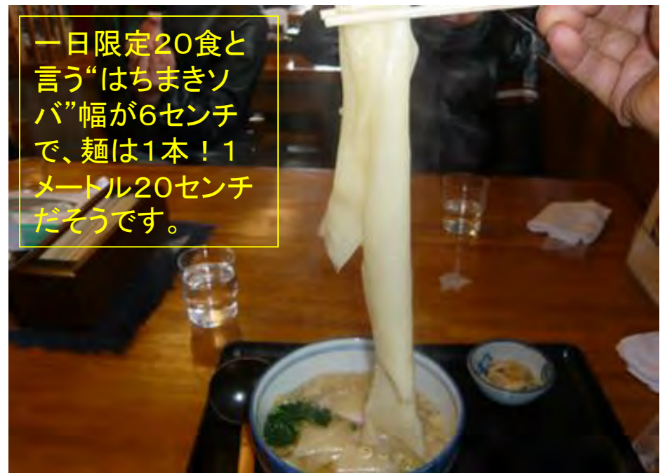
一日限定20食と言う“はちまきソバ”幅が6センチで、麺は1本！1メートル20センチだそうです。