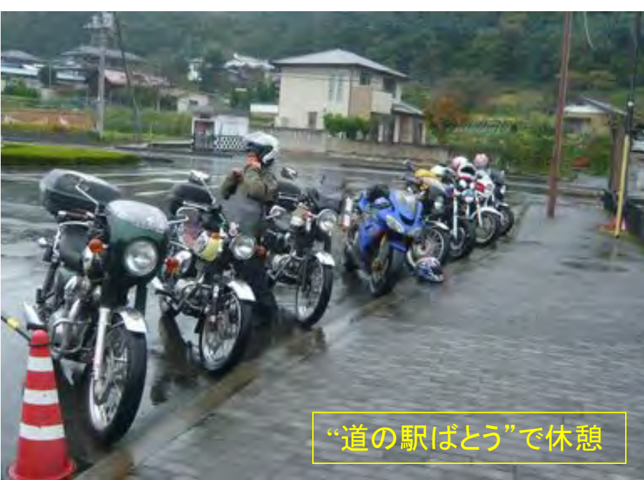
“道の駅ばとう”で休憩