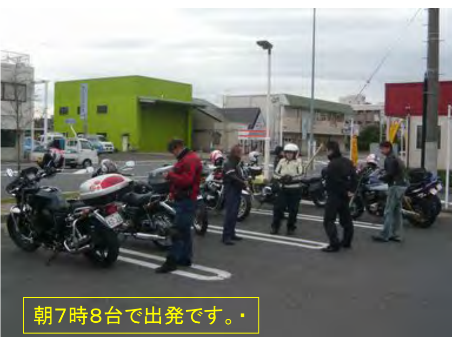
朝7時8台で出発です。