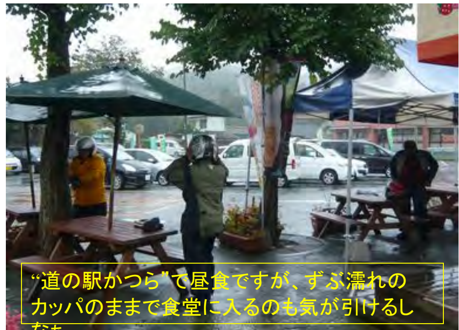
“道の駅かつら”で昼食ですが、ずぶ濡れの カッパのままで食堂に入るのも気が引けるし なあ