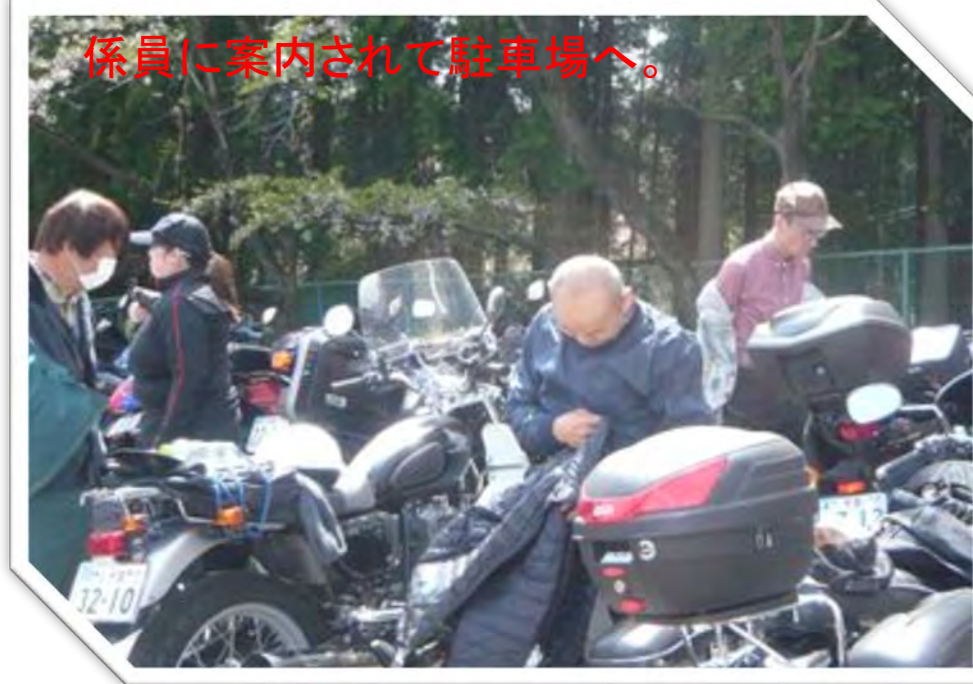
係員に案内されて駐車場へ。