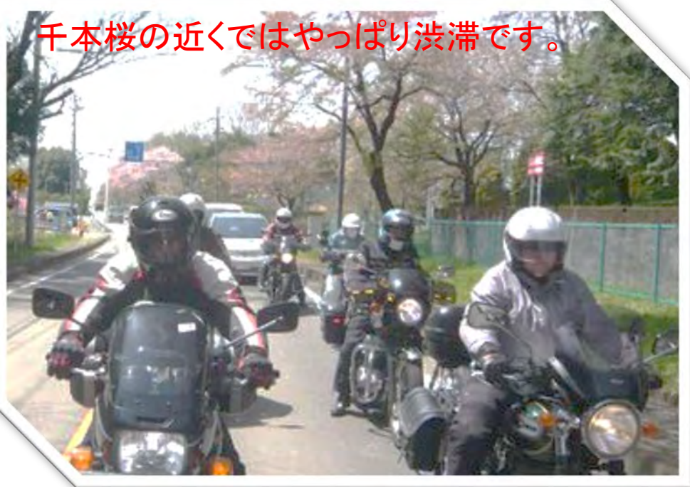
千本桜の近くではやっぱり渋滞です。