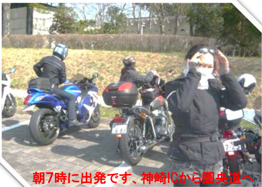
朝7時に出発です、神崎ICから圏央道へ