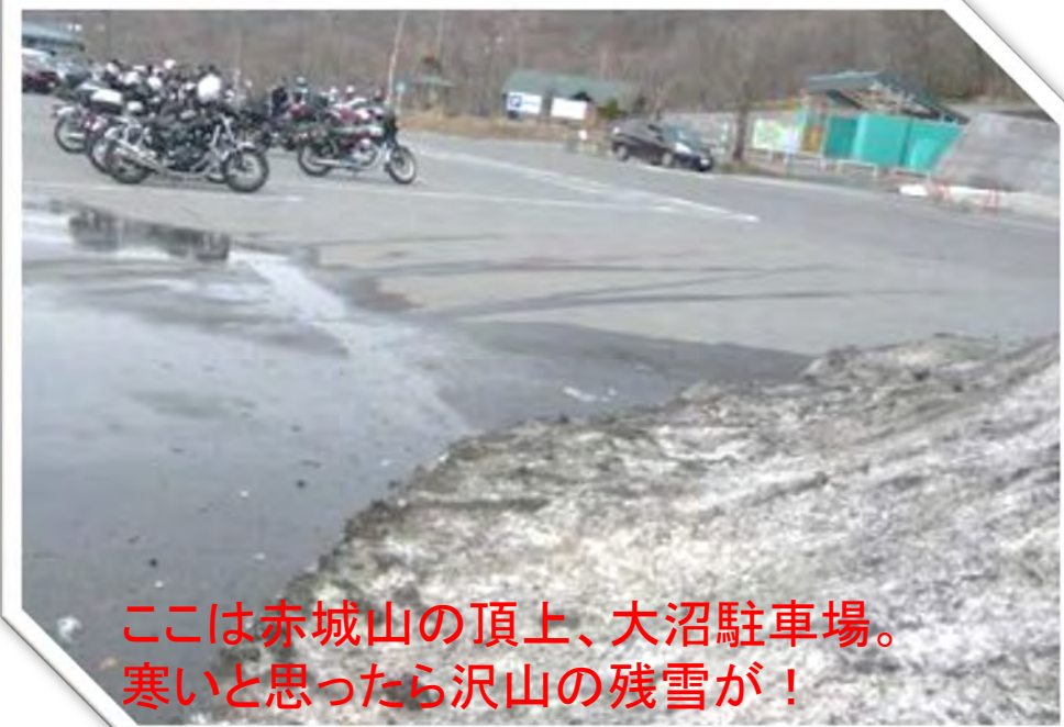
ここは赤城山の頂上、大沼駐車場。 寒いと思ったら沢山の残雪が！