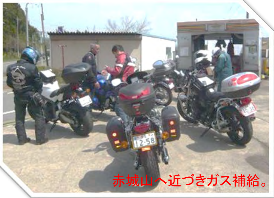
赤城山へ近づきガス補給。