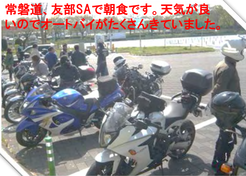
常磐道、友部SAで朝食です。天気が良いのでオートバイがたくさんきていました。